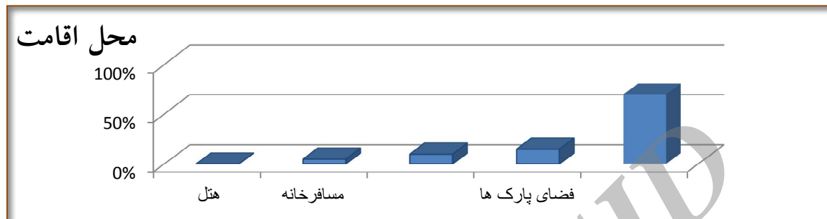
شکل شماره ۲- نمودار توزیع گردشگران بر اساس محل اقامت

اقوام و آشنایان خود به این شهر وارد می شوند لذا محل اقامت اقوام را برای محل سکونت خود در مدت حضور در این شهر انتخاب می کنند. میزان استفاده کنندگان از هتل در شهر صفر می باشد که این امر به دلیل وجود هتل در سطح شهر ری ارائه شده است حمایت از بخش خصوصی هنوز ساخت هتل در سطح این شهر به نتیجه نرسید.