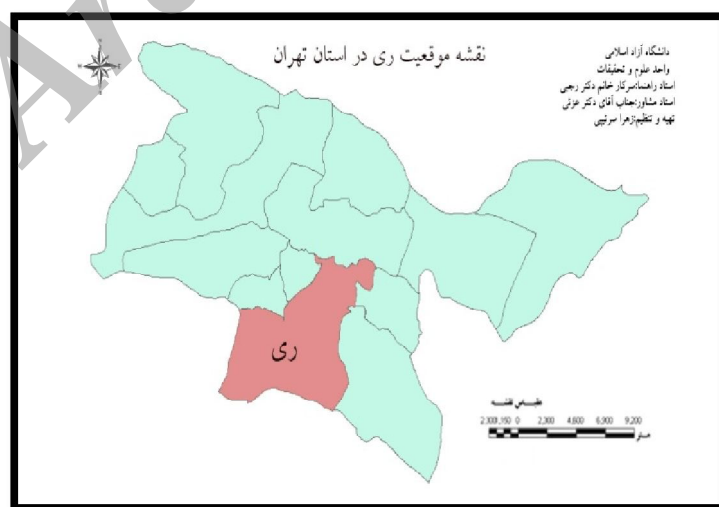
شکل شماره ۱- نقشه منطقه مورد مطالعه

صنعت گردشگری از جایگاه خاصی از لحاظ اقتصادی و تجاری برخوردار بوده و از لحاظ اجتماعی و فرهنگی نیز تأثیر گذار خواهد بود. همانطور که در برخی از منابع ذکر گردیده است جهانگردی باعث ایجاد مشاغل مختلف می گردد و حدوداً ۲۰۰ میلیون شغل در سراسر دنیا ایجاد کرده است (اندی درام، آلن مور، ۱۳۸۸: ۹) و در دنیا بودجه ای که به مسافرت و تفریح اختصاص می یابد سه برابر بودجه ای است که صرف امور دفاعی می شود (دلفانی، ۱۳۸۶: پیشگفتار) (هال: ۹). همچنین باعث تبادل فرهنگی بین ملتها شده و موجبات استحکام پیوندهای اجتماعی ملت ها را فراهم ساخته و در بسط و گسترش روابط جهانی، نقش برجسته ای را ایفا می نماید (منشی زاده، ۱۳۸۴: ۷۲). در دین اسلام نیز به سفر رفتن و بدست آوردن تجربه و دیدن اماکن و منطقه های مناسب که بتواند ذهن و فکر بشر را به سوی خالق هستی سوق دهد تأکید فراوان شده است (شایان و همکاران ۱۳۸۸: ۹۴) در این زمینه نیز نباید از کشور خودمان "ایران" غافل باشیم که با وجود اماکن تاریخی و جاذبه های طبیعی و اماکن زیارتی هنوز نتوانسته جایگاه ویژه ای برای خود پیدا نماید (نوریخس، ۱۳۸۹: مقدمه). در این مقاله شهر ری به عنوان شهری تاریخی و مذهبی برگزیده شده تا با تجزیه و تحلیل جنبه های مختلف آن بتوان به این پرسش پاسخ داد: که شهر ری با داشتن پتانسل های متعدد برای گردشگری در زمینه توریسم مذهبی تا چه حد منشأ تغییر و تحول بوده است و گردشگری چگونه بر روی فرهنگ و فضای کالبدی و اقتصادی و ... تأثیر گذار بوده است؟