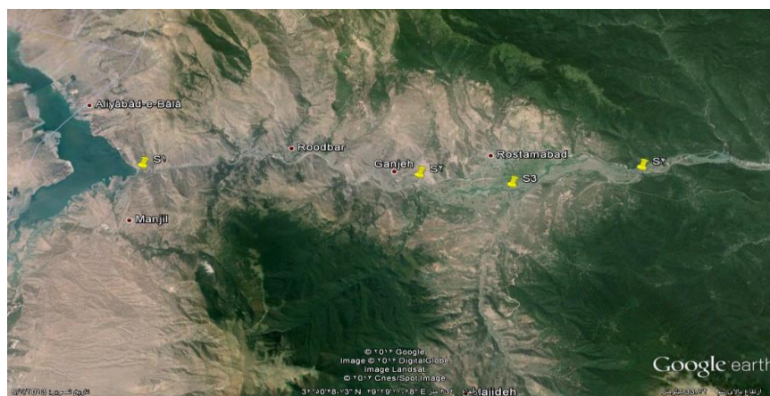
شکل ۱: موقعیت ایستگاه‌های نمونه‌برداری.

در این پژوهش ابتدا موقعیت رودخانه سفیدرود در محدوده مورد مطالعه با استفاده از نقشه‌های ۱:۲۵۰۰۰ در سامانه اطلاعات جغرافیایی به منظور تعیین ایستگاه‌های مناسب پردازش گردید. با توجه به طول تقریبی ۳۵ کیلومتر در این محدوده، و پس از بررسی نقشه‌ها و بازدیدهای میدانی، به جهت بررسی امکان دسترسی و نمونه‌برداری، امکان ورود آلاینده‌های نقطه‌ای و غیرنقطه‌ای و وضعیت اتصال شاخه‌های فرعی به سفیدرود موقعیت ایستگاه‌ها انتخاب گردید. بر همین اساس یک ایستگاه در بالادست، ورودی رودخانه سفیدرود به استان گیلان و دو ایستگاه در مسیر میانی رودخانه به جهت تعیین تغییرات کیفی پارامترها در طی مسیر و دریافت شاخه فرعی و به دلیل منابع ورودی آلاینده‌ها به رودخانه انتخاب شده‌اند و ایستگاه آخر در پایین‌دست رودخانه در محدوده مورد مطالعه انتخاب گردید (شکل ۱).