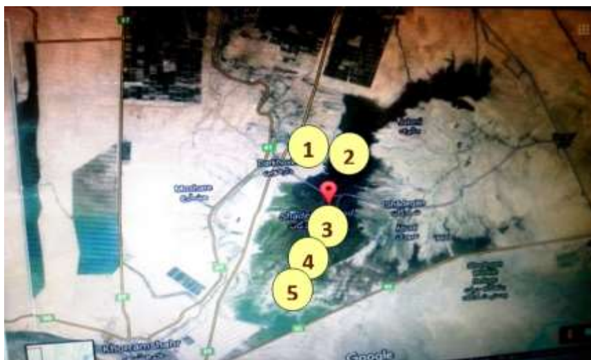
شکل ۲: نمونه‌برداری در تالاب شادگان، خوزستان، ایران سال ۱۳۹۰.

ریسک اکولوژیکی، غلظت اثر زیست‌محیطی (EEC) ۵ آفت‌کش (ددت، آلدین، دی‌الدرین، آمترین و لیندان) در ۵ فضای سه‌بعدی (Compartment) از آب‌های شور و شیرین اندازه‌گیری شد (اصطلاح فضای سه‌بعدی به دلیل نمونه‌برداری در تالاب که دارای طول، عرض و ارتفاع بوده و دارای حجم است به‌کاربرده شده است). این آفت‌کش‌ها به‌عنوان یک تجزیه و تحلیل‌گر هدف بر اساس استفاده در صنعت توسعه نیشکر در منطقه و کاربرد آن‌ها انتخاب شده‌اند. به نظر می‌رسد که استفاده از آفت‌کش‌های ارگانوکلره در ایران از سال ۱۹۸۳ ممنوع شده اما این روند همچنان ادامه دارد. انتخاب فضای سه‌بعدی بر اساس جریان، شوری آب و توپوگرافی بستر صورت می‌پذیرد. اولین فضای سه‌بعدی به‌طور تقریبی در محل خروجی توسعه نیشکر و آخرین فضای سه‌بعدی در فاصله دورتر از خروجی‌ها و در محور طولی هم‌دیگر قرار دارند. تمامی این فضاهای سه‌بعدی در (شکل ۲) نشان داده شده‌اند. مختصات این نقاط در (جدول ۱) آمده است. نمونه‌برداری آب به‌طور فصلی (بهار، تابستان، پاییز و زمستان ۱۳۹۰) و در ۵ فضای سه‌بعدی نمونه‌برداری صورت پذیرفت. نمونه‌های تکرار یافته در عمق ۰/۵ متری با استفاده از بطری‌های آب برداشته شدند. نمونه‌ها در دمای ۴ درجه سانتی‌گراد و به مدت ۴۸ ساعت جهت تجزیه و تحلیل ذخیره شدند. جمع‌آوری تمامی نمونه‌ها بر اساس استانداردهای کنترل کیفیت (QC) و تضمین کیفیت (QA) صورت پذیرفت.