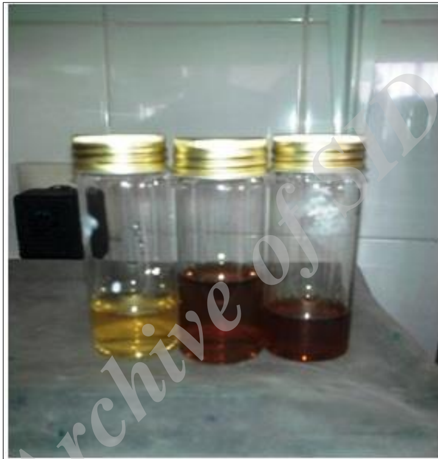
شکل ۱: تغییر رنگ محلول با گذشت ۹۰ دقیقه زمان از قهوه ای متمایل به زرد کم رنگ به قهوه ای تیره پس از اضافه نمودن محلول نیترات نقره (Bita et al. , 2015).

در این مطالعه از نانو ذرات نقره سنتز شده از عصاره جلبک دریایی Sargassum angustifolium با غلظت ۱۰۵/۷ میلی گرم در لیتر و اندازه ذرات ۳۲/۵۴ نانومتر (Bita et al. , 2015) برای بررسی تأثیر آن بر شاخص های خونی ماهی کپور معمولی ( Cyprinus carpio ) استفاده شد (شکل ۲).