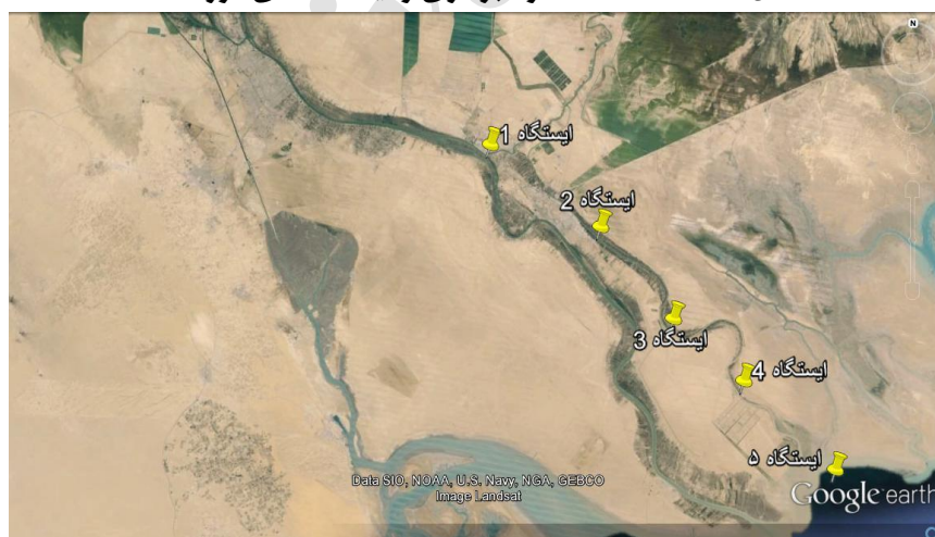
شکل ۲: عکس ماهواره‌ای موقعیت ایستگاه‌های نمونه برداری در رودخانه بهمن شیر.

برای نمونه برداری از آب، بطری نمونه بردار روتنر به عمق یک متری فرستاده شده و نمونه برداری در هر ایستگاه با ۳ تکرار انجام شد. نمونه‌های آب در بطری‌هایی که از قبل استریل شده بودند ریخته و به آزمایشگاه منتقل شدند. بطری‌ها با محلول آب مقطر و اسید نیتریک ۲ درصد (ساخت شرکت مرک آلمان) شستشو گردیدند.