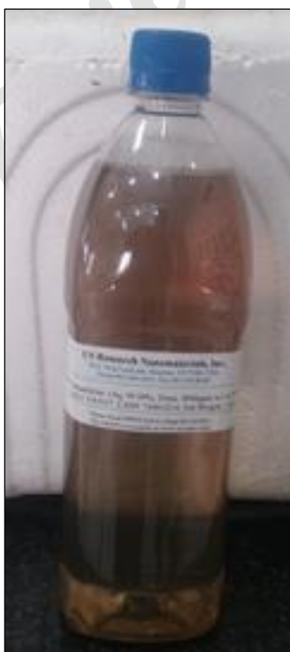
شکل ۱: نمونه نانو ذرات کلئید استفاده شده در تحقیق.

از نانو ذرات نقره کلئید تولیدی US Research Nanomaterials, Inc. کشور آمریکا استفاده گردید. این محصول حاوی نانو ذرات نقره با خلوص ۹۹/۹۹ درصد با اندازه متوسط ۲۰ نانومتر و غلظت ۴۰۰۰ میلی‌گرم در لیتر می‌باشد. محصول به شکل مایع و با رنگ متمایل به قهوه‌ای و در بسته‌بندی یک لیتری تهیه گردید.