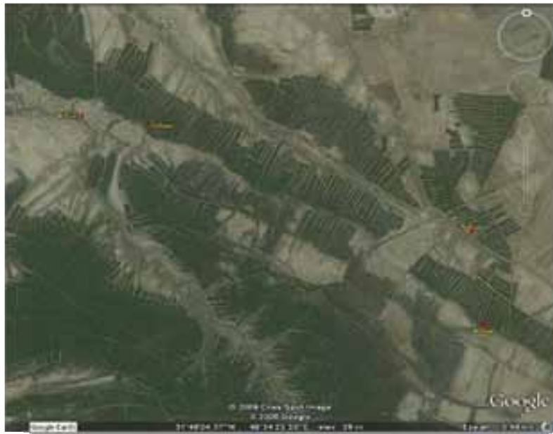
شکل ۲: موقیت ایستگاه های ۴، ۵، ۶، ۷ در تالاب بامدژ (۱۳۸۷)

در هر ایستگاه ابتدا موقعیت جغرافیایی با استفاده از موقعیت یاب GPS مشخص شده و در هر ایستگاه ۳ نمونه رسوب توسط گرب ون وین جهت مطالعه ماکروبنوتوز برداشت و به ظروف پلاستیکی منتقل و با میزان کافی فرمالین ۵ درصد تثبیت شد. پس از انتقال نمونه های رسوبی به آزمایشگاه محتویات هر ظرف پلاستیکی را به دقت در الک با چشمه ۰/۵ میلی متر آنقدر شستشو داده تا دیگر هیچ رسوبی از الک خارج نشود. سپس محتویات الک بر اساس روش Walton در سال ۱۹۷۴ رنگ آمیزی شدند. بر اساس این روش نمونه ها توسط محلول ۱ گرم در لیتر رزبنگال که یک ماده حیاتی است و پروتوپلاسم سلولهای موجودات با آن رنگ می گیرند رنگ آمیزی شد. پس از جدا سازی و شناسایی، شمارش گردیدند.