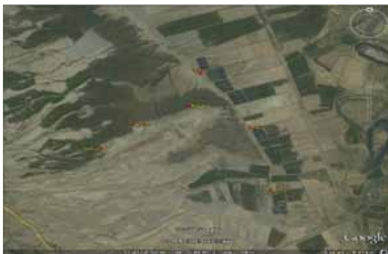
شکل ۱: موقیت ایستگاه های ۱، ۲، ۳، ۸، ۹، ۱۰ در تالاب بامدژ (۱۳۸۷)

برای سنجش فاکتور دما از دما سنج (Thermometer) ، و برای اندازه گیری فاکتور شوری از شوری سنج (رفراکتومتر) استفاده شده است.