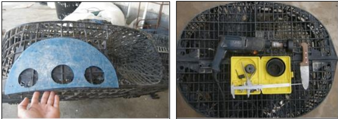
شکل ۳: نمایی از ادوات بکار گرفته شده در طول این تحقیق به منظور بهینه‌سازی قفس صید لابستر صخره‌ای خاردار ( Panulirus homarus ) در دریای عمان با تغییر در جانمایی و اندازه دریچه خروج در سال ۱۳۸۹.

کلید اطلاعات حاصله در نرم افزارهای Excel ۲۰۰۷ و SPSS ۱۵ وارد و سپس مورد تجزیه و تحلیل قرار گرفت. برای مقایسه میانگین نتایج تیمارهای مورد آزمایش از آنالیز واریانس یک طرفه و آزمون چند دامنه‌ای دانکن استفاده شد. خطا در سطح P < 0.05 بررسی گردید.