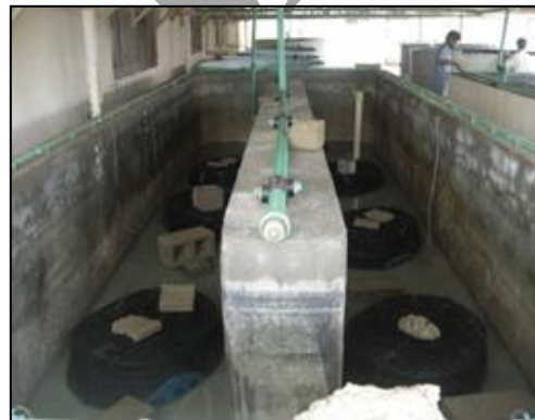
شکل ۱: استخر بتونی مورد استفاده در کارگاه تکثیر مرکز تحقیقات شیلات چابهار و جانمایی قفس‌های مربوط به تیمارهای لابستر خاردار ( Panulirus homarus ) در سال ۱۳۸۹.

کارایی دریچه خروج روی قفس از نظر جانمایی و اندازه دریچه به عنوان تیمارهای تحقیق و هر تیمار با ۳ تکرار در استخرهای بتونی به صورت ذیل مورد بررسی قرار گرفت: