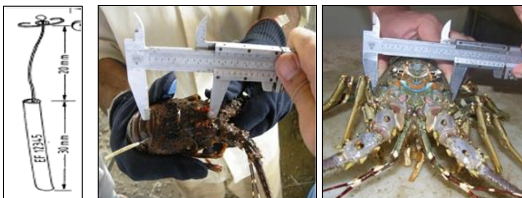
شکل ۲: تصویر سمت چپ، نشانه مخصوص نشانه‌گذاری لابستر و تصویر سمت راست، اندازه‌گیری طول و عرض کاراپاس لابستر ( Panulirus homarus ) نشانه‌گذاری شده با کولیس در شروع تحقیق در سال ۱۳۸۹.

لابسترها بر اساس طول کاراپاس به پنج کلاس طولی به شرح زیر تقسیم گردید: