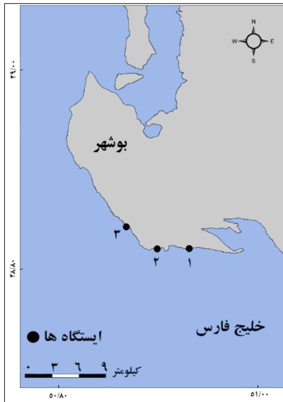
شکل ۱: موقعیت ایستگاه‌های مورد بررسی در سواحل خلیج فارس در منطقه بوشهر.

به منظور بررسی تأثیر عمق (محل قرارگیری) بستر در منطقه بین جزرومدی بر روی پراکنش S. cucullata ابتدا حد میانی جزر و مد در مناطق بین جزرومدی در هر یک از ایستگاه‌ها مشخص گردید. بسترهای مختلف مورد بررسی در بخش‌های بالاتر و پایین‌تر از حد میانی منطقه بین جزرومدی مورد بررسی قرار گرفتند. جهت بررسی تأثیر جنس بستر بر پراکنش و رشد S. cucullata در هر ایستگاه سه نوع بستر مختلف مورد بررسی قرار گرفت. بسترهای مورد بررسی شامل صخره‌های طبیعی، بلوک‌های سیمانی و سطوح فلزی (آهنی) می‌باشند که هر سه نوع در منطقه وجود دارند. تعداد افراد گونه مورد نظر بر روی بسترهای مختلف طی هر نمونه برداری ثبت گردید. به منظور شمارش تعداد افراد از یک کوادرات 25 \times 25 سانتی‌متر استفاده گردید. به منظور تعیین نسبت فراوانی S. cucullata به کل گونه‌های جانوری بیوفولینگ، تعداد افراد سایر گونه‌های حاضر روی بسترهای مختلف نیز شمارش شد و نسبت تعداد افراد گونه مورد نظر به تعداد کل افراد جامعه بیوفولینگ به عنوان فراوانی نسبی این گونه محاسبه شد. در هر ایستگاه سه نقطه انتخاب گردید و در هر نقطه سه بار در هر یک از انواع بسترها کوادرات انداخته شد. نمونه برداری‌ها در فصل تابستان و زمستان ۱۳۹۵ انجام گرفتند.