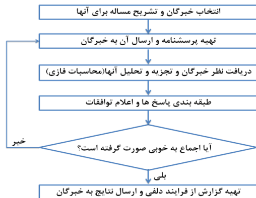
شکل ۱. الگوریتم اجرای روش دلفی

برای پالایش و گزینش مؤلفه‌های تأثیرگذار بر توانمندسازی منابع انسانی دانشگاهی از روش دلفی‌فازی استفاده شده است. روش دلفی‌فازی را Kaufman and Gupta در دهه هشتاد میلادی ابداع کرد. [۱۷] کاربرد این روش به منظور تصمیم‌گیری و اجماع بر مسائلی است که اهداف و پارامترها در آن به صراحت مشخص نیستند. بسیاری از مشکلات در تصمیم‌گیری‌ها مربوط به اطلاعات ناقص و نادقیق است. هم‌چنین تصمیمات گرفته‌شده خبرگان براساس صلاحیت فردی آنان و به شدت ذهنی است. بنابراین بهتر است داده‌ها به جای اعداد قطعی با اعداد فازی نمایش داده شوند. مراحل اجرایی روش دلفی‌فازی در واقع ترکیبی از اجرای روش دلفی و انجام تحلیل‌ها روی اطلاعات با استفاده از تعاریف نظریه مجموعه‌های فازی است. الگوریتم اجرای روش دلفی‌فازی در نگاره شماره یک نمایش داده شده است.