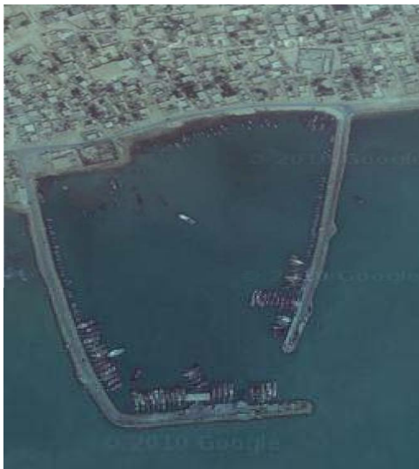
شکل ۱- عکس ماهواره ای از اسکله بندرگاه در بوشهر، محل تهیه نمونه ها

تحقیق انجام شده در ماه‌های بهمن ۱۳۸۸ و شهریور ۱۳۸۹ بر روی ماهیان صید شده از بندر بوشهر با مختصات جغرافیایی ۲۸ درجه و ۴۲ دقیقه‌ی عرض شمالی و ۵۰ درجه و ۵۴ دقیقه‌ی طول شرقی انجام گرفت. در هر بار نمونه برداری ۹ عدد ماهی صید و انتخاب و پس از بیومتری در ۳ محدوده‌ی اندازه‌ای ۲۷ تا ۳۲ سانتی متر (ماهی کوچک)، ۳۲ تا ۳۷ سانتی متر (ماهی متوسط) و ۴۱ تا ۴۶ سانتی متر (ماهی بزرگ) تفکیک گردید. ماهی‌ها داخل کیسه‌ی پلاستیکی قرار داده شده و در دمای ۳۰- درجه‌ی سانتی گراد تا زمان آنالیز نگهداری شدند.