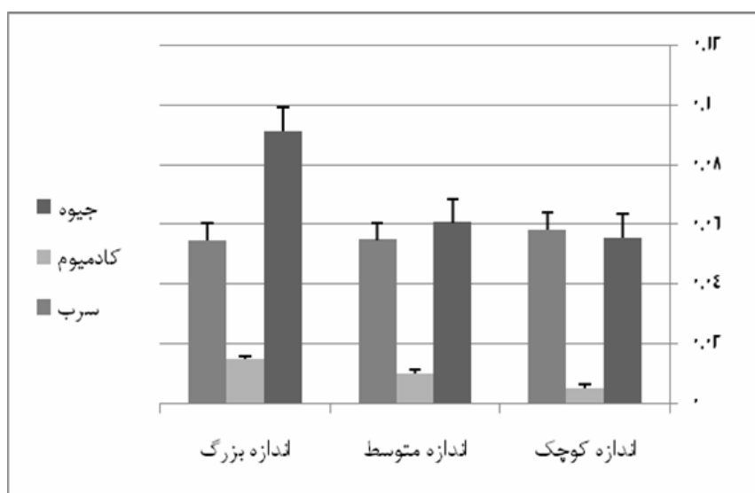
شکل ۲ - میانگین غلظت فلزات سنگین بر حسب میکروگرم در گرم در ماهی شوریده با اندازه های مختلف محدوده بندرگاه بوشهر، زمستان ۱۳۸۸ و تابستان ۱۳۸۹ (آنتنک ها نشان دهنده انحراف معیار است)

میانگین غلظت فلزات سنگین جیوه، کادمیوم و سرب در نمونه های ماهی شوریده در دو فصل زمستان و تابستان به ترتیب 0.0689 \pm 0.0062 ، 0.0100 \pm 0.0011 و 0.0558 \pm 0.0032 میکروگرم بر گرم بر حسب وزن خشک می باشد. به منظور بررسی آماری داده ها از نرم افزار SPSS V.17 استفاده شد. نرمال بودن داده ها مورد تأیید قرار گرفت.