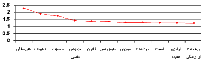
جدول ۲. جمع‌بندی دور پنجم