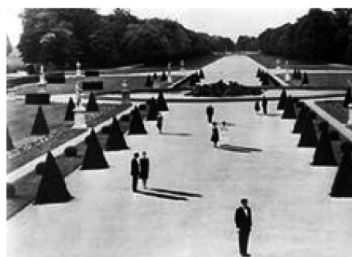
تصویر ۱- نمایی از فیلم سال گذشته در مارین باد. در این تصویر سورئالیستی، زوج‌ها سایه‌های بلندی دارند، اما درخت‌ها سایه ندارند (نشانه‌ای تصویری بر اعتمادناپذیری گفته‌های راوی).

فیلم سال گذشته در مارین باد ۱۹ (۱۹۶۱) به کارگردانی آلن رنه، ساختار روایت ابهام‌آمیز و رویاگونه‌ای را ارائه می‌دهد که در آن تمایز واقعیت و خیال دشوار است. رابطه زمان و فضا و روابط علی و معلولی نیز در این اثر پرسش برانگیز است. در این فیلم در هتلی مردی به سمت زنی رفته و ادعا می‌کند که آنها سال گذشته یکدیگر را در محلی به نام مارین باد ملاقات کرده‌اند. اما زن اصرار دارد که آنها هرگز قبلاً یکدیگر را ملاقات نکرده‌اند. مرد دومی نیز در داستان وجود دارد که ادعا می‌کند شوهر زن است. پس‌نماهایی مبهم و تغییرات زمان و مکانی گیج‌کننده، روابط میان شخصیت‌ها را به شکلی اعتمادناپذیر ترسیم می‌کند. مکالمات و وقایع تکراری در بخش‌های گوناگون هتل، و نیز مشاهده‌نماهای تعقیبی، مخاطب را به شنونده روایت صدا - روی - تصویر ۲۰ مبهمی تبدیل می‌کند.