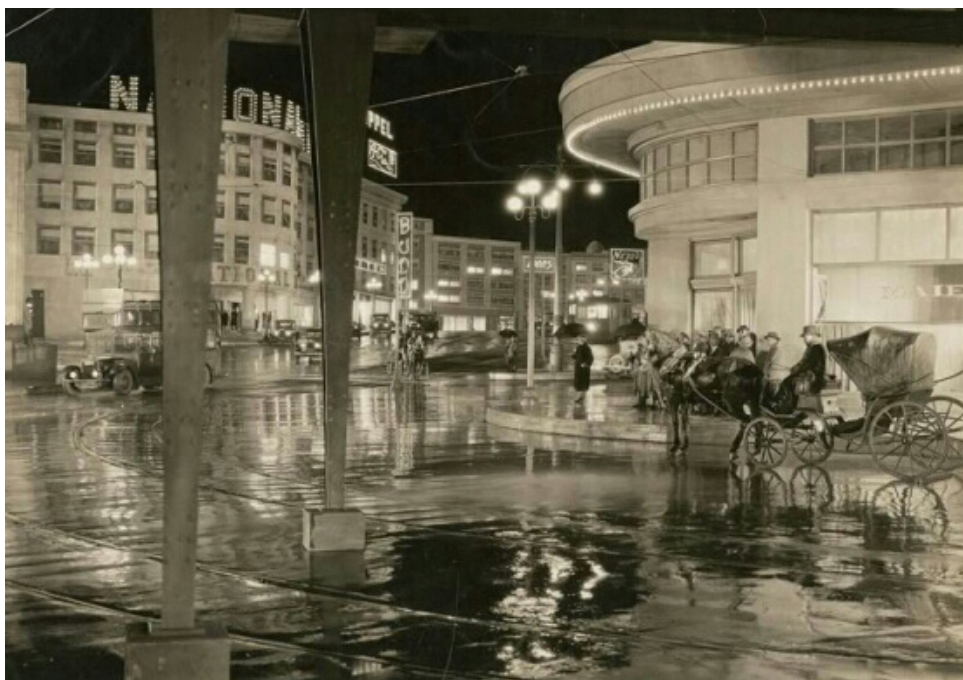
تصویر ۵ - نمای شهر خیالی در طلوع مورنائو.

جولیانا برونو، نقشه‌نگاری را بستری برای پیوند میان دو حیطه فیلم و معماری برمی‌شمارد، و با معرفی نقشه‌های سینمایی به مثابه فرم جدیدی از نقشه‌های احساسی موقعیت‌گراها، بحث می‌کند که «براستی، با بازنمایی‌های فیلمیک، مفهوم جغرافیا نیز تغییر یافته و به تحرک درآمده است... به مثابه الگویی برای نقشه‌نگاری‌های فرهنگی، فیلم کار توگرافی مدرن است. [فیلم] یک نقشه سیال است - نقشه‌ای از تفاوت‌ها، محصولی از قطعه‌های اجتماعی، جنسیتی و سفرهای میان فرهنگی» (Bruno, 2002, 71). تام کانلی (Conley, 2007)، سینما را رسانه لوکیشن‌محور ۱۱ می‌نامد و بحث می‌کند که از زمان پیدایش روایت در سینما، و می‌توان گفت از همان آغاز شکل‌گیری سینما، نقشه‌ها وارد حیطه تصویر شدند، تا دلالت داشته باشند به مکانی که اتفاقی در آنجا روی می‌دهد ۱۲ . وجود نقشه در داستان، تضمین این نکته به بیننده است که آنچه نمایش داده شده واقعیت دارد، حتی اگر فیلم‌ها، نقشه را به عنوان بخشی از جریان روایت نمایش ندهند، رابطه‌ای بی‌واسطه میان فیلم و نقشه وجود دارد. کانلی معتقد است که زبان بیانی سینما، چندان در ارتباط با الگوی زبان‌شناسی نیست و بیشتر با ساختار نقشه قابل مقایسه است. وی با انتقاد از رویکرد زبان‌شناسانه به حوزه مطالعات فیلم، بر چندوجهی بودن و غیرقابل ترجمه بودن اصطلاحات سینمایی تاکید می‌کند. نقشه‌های فیلمیک از منظر کانلی، به یک رابطه تعاملی میان