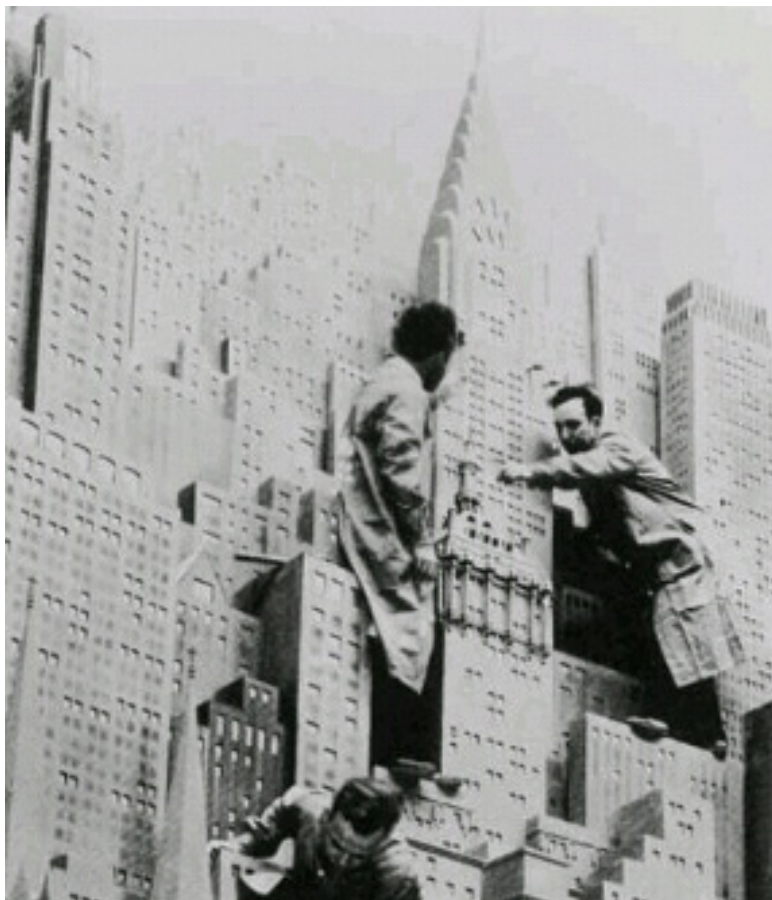
تصویر ۲ - آماده کردن شهر مجازی برای فیلم متروپولیس فریتز لانگ. ماخذ: (Mennel, 2008, 40)

سینمای اولیه، در عین حال که تماشاگران را به سمت فضای پر آشوب زندگی متروپولیس مدرن جذب می‌کرد، به آنها کمک می‌کرد تا خود را با ضرباهنگ و ریتم نامتعادل خیابان‌های متروپولیس و تغییرات دراماتیک زندگی مدرن شهری، وفق دهند. میریام هانسن در کتاب بابل و بابلون : پدیده تماشاگری در فیلم صامت آمریکایی، اظهار می‌کند که با جریان یافتن تصاویر متحرک فیلم در شبکه نوظهور شهری مدرن، سینما به عنوان رابطه‌ای میان شهروندان و تجربه شهری عمل می‌کرد. هانسن بر پایه مباحث اندیشمندان مکتب فرانکفورت و به خصوص بنیامین و کراکاتر، ظهور پدیده تماشای فیلم در فرهنگ شهری مدرن را مورد بررسی قرار می‌دهد و می‌نویسد که سینما «از زمان ظهورش در ۱۸۹۵، خود را به مثابه نمایش‌دادن فیلم‌ها بر روی یک پرده ثابت در برابر توده جمعی، تبیین کرد» (Hansen, 1991, 23) و به این واسطه، افقی را برای تجربه مدرنیزاسیون و مدرنیته برای شهروندان در متروپولیس، فراهم کرد. فیلمسازان اولیه - برادران اسکلا دانوفسکی در آلمان، برادران لومیر در فرانسه، کمپانی میتچل و کنیون در انگلستان، و توماس ادیسون در آمریکا - علاوه بر آنکه فضاهای شهری مدرن را در فیلم‌هایشان به تصویر می‌کشیدند، این فضاها را