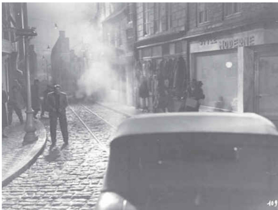
تصویر ۳- درهم‌آمیختگی ذاتی سینمای نوآر با فضاهای شهری. ماخذ: (Dickos, 2002, 45)

در سینمای موج نوی فرانسه، شهر تبدیل به منبع الهامی برای فیلمسازان شد و کارگردانان، از شبکه خیابان‌های شهری به عنوان بستری برای شکل‌گیری آثارشان استفاده کردند. متأثر از نئورئالیسم ایتالیا، کارگردان‌های موج نو (فیلمسازانی چون فرانسوا تروفو، آلن رنه، لویی مال، کلود شابرول، ژان لوک گدار، ژاک ریوت، اریک رومر، ژاک دمی و آگنس واردا)، برای نمایش انزجارشان از سلطه سینمای سنتی فرانسه، شعار «رفتن به خیابان‌ها» را به عنوان یکی از اصول سینمایی خود تبیین نمودند. در این میان