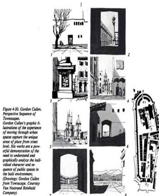
Figure 4-30. Gordon Cullen. Perspective Sequence of Townscapes. Gordon Cullen's graphic illustrations of the experience of moving through urban spaces capture the unique sense of place from street level. His works are a powerful demonstration of the need to understand and graphically analyze the individual character and sequence of public spaces in the built environment. (Drawings: Gordon Cullen from Townscape. Courtesy Van Nostrand Reinhold Company)

وی با به چالش کشیدن تقسیم‌بندی مرسوم میان مفاهیم «واقعی» و «سینمایی»، تاکید می‌کند که به همان منوال که پیچیدگی، تکثر و مشخصه‌های تناقض‌آمیز شهر مدرن در بطن خود شکل‌گیری شهرهای خیالی را پروراند، امروزه فیلم‌ها نیز بسیار فراتر از بازنمایی صرف عمل می‌کنند، و به گونه‌ای بالقوه، نقشی «مولد» در شکل‌دهی به فضاهای شهری واقعی یافته‌اند. بزعم الصیاد، با کم‌رنگ شدن مرز بین فضای سینماتیک و فضای واقعی، و ارتباط جدایی‌ناپذیر میان شهرهای واقعی و شهرهای سینمایی، پدیده تقلید شهر واقعی از شهر سینمایی، به یکی از مباحث اساسی شهرسازی تبدیل گردیده است. وی، استفاده و بهره‌گیری از روایت‌های فیلمیک و فضاسازی‌های قطعه قطعه سینمایی را در فرایند طراحی، به مثابه ابزاری جهت رسیدن به الگویی از شهرسازی سینماتیک معرفی می‌کند.