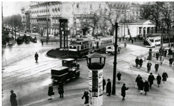
تصویر ۱- پویایی و تحرک متروپولیس در برلین، سمفونی شهر بزرگ، اثر والتر روتمان. ماخذ: (Mennel, 2008, 39)

تبدیل شود، گونه‌ای با میانجی‌گری آپاراتوس سینما» (cited in Bruno, 1993, 191). ازرا پاند، از کیفیت سینماتوگرافیک توالی و برهم‌نمایی تصاویر در شهر مدرن یاد می‌کرد، و تصاویر متحرک سینمایی، این توانایی را داشتند که شهر را به مثابه مجموعه‌ای از تصاویر متحرک، بازنمایی کنند. (Shiel & Fitzmaurice, 2003) فیلم‌ها از ابزارهای روایی نو، تکنولوژی‌های بصری و تکنیک‌های تدوین، در جهت همگامی با ضرباهنگ زندگی شهری استفاده می‌کردند. این تعامل فیلمسازان اولیه با پویایی شهری، تاثیراتش را بر زبان سینمایی نیز باقی گذاشت؛ اصطلاح تراکینگ‌شات ۵ ، اشاره به قرار گرفتن دوربین بر روی تراک دارد، که ریشه‌اش به سینمای اولیه و قرار گرفتن دوربین بر روی ماشین‌ها و ترن‌ها به منظور اکتشاف فضاهای شهری باز می‌گردد. حرکت پن دوربین را نیز که در فرانسه پانارومیکو ۶ و در ایتالیایی پانورامیکا ۷ نامیده می‌شود، در پیوند با نقاشی‌های پانورامایی قرون ۱۸ و ۱۹، و بعدها نقاشی‌های پانورامایی از لنداسکیپ‌ها و به خصوص منظره‌های شهری می‌توان ریشه‌ابی کرد (Bruno, 2002). در فیلم‌های شهری اولیه، فیلمسازان با بکارگیری انواع حرکات دوربین - پن‌های چرخشی، تیلت به سمت بالا و پایین، تراکینگ شات‌ها- و گاه با قراردادن دوربین بر روی اتومبیل‌ها، ترن‌های متحرک و حتی بالن‌هایی بر فراز شهر، سعی می‌کردند تا زاویه‌دیدهای متنوعی را از منظره‌های شهری به نمایش بگذارند (تصویر ۱).