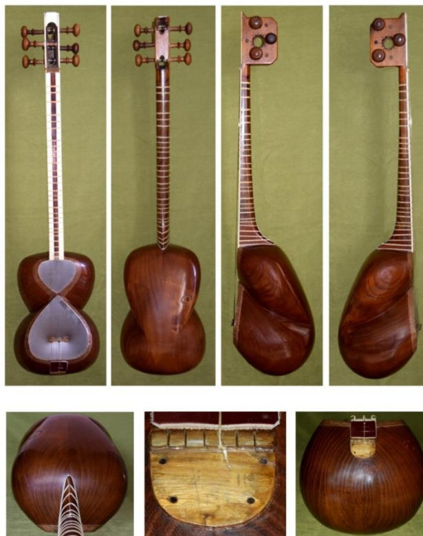
تصویر ۱. نمونه یک تار عکاسی شده از زوایای مشخص

درباره عکاسی از تارها گفتنی است، برای اینکه شرایط عکاسی برای همه سازها یکسان باشد و به سبب آنکه امکان انتقال سازها به مکان ثابتی فراهم نبود، پایه‌ای ساخته شد تا با یک پس‌زمینه ثابت بتوان تارها را به شکل آویخته روی پایه قرار داد و از زوایای مهم تارها عکس گرفت. همچنین، فرمی آماده شد تا همه اطلاعات ساز، که به شناخت آن کمک می‌کند، در آن درج شود. سرانجام، نتیجه کار برای هر ساز به این شکل شد: