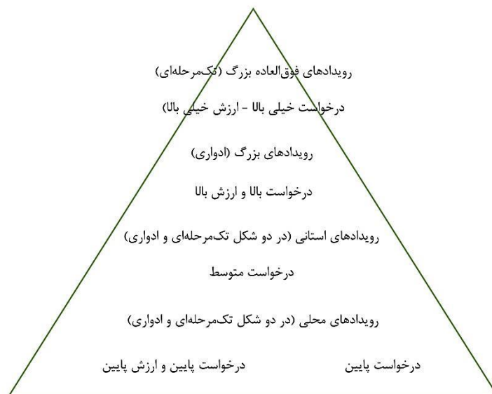
تصویر ۲. هرم انواع رویدادهای گردشگری براساس میزان اهمیت، تناوب تکرار، و بهره‌های اقتصادی. مأخذ: Getz, 2005