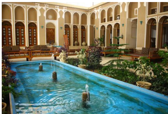
تصویر ۸. خانه مظفر در شهر یزد، از اماکن میراث معماری کویر مرکزی ایران. از آن به‌عنوان اقامتگاه گردشگران استفاده می‌شود.

علاوه بر فضاهایی که اصالتاً در آن‌ها فعالیت‌های موسیقایی شکل می‌گیرد، می‌توان اماکنی را که دارای پتانسیل‌های فرهنگی‌اند برای کاربردهای چندگانه، که اجرا یا آموزش موسیقی یکی از چنین کارکردهایی است، اختصاص داد. از باب نمونه، در مجموعه سعدی، در شهر شیراز، کارگاه‌هایی برای تولید و عرضه صنایع دستی این شهر اختصاص داده شده است که گردشگران این مجموعه، علاوه بر بهره‌مندی از فضای آرامگاه این شاعر نیکوسخن شعر فارسی، از این کارگاه‌ها دیدن می‌کنند.