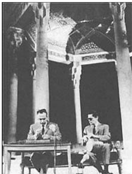
تصویر ۳. اجرای هنرمندان صاحب‌نام ایرانی در کنار مقبره حافظ (فرامرزی پاپور و حسین تهرانی).

مشتاقان آثار آنان جالب است. بسیاری از هنرمندان با قرار گرفتن در محل جغرافیایی خاص به آفرینش موسیقی می‌پردازند؛ به گونه‌ای که این اماکن با خلاقیت ذهنی آن‌ها پیوند می‌خورد. اجرای برنامه‌های صحنه‌ای در شهرهایی مانند شیراز و اصفهان، که موطن شاعران و هنرمندان پُرآوازه بوده است، نیز باعث جذب گردشگران بسیاری برای حضور در چنین برنامه‌هایی می‌شود. از باب نمونه، نگاه کنید به اجرای هنرمندان صاحب‌نام ایرانی در کنار مقبره حافظ (تصویر ۳).