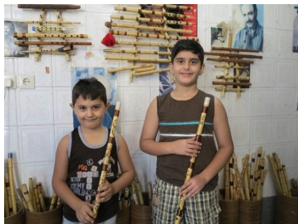
تصویر ۷. گردشگران در حال بازدید از کارگاه خصوصی ساخت سازهای بادی در مرودشت استان فارس. این کارگاه‌ها یکی از جاذبه‌های گردشگری موسیقی در این شهرستان است

سازسازها در اغلب اوقات خود نیز نوازنده‌اند و برای ساخت ساز از ابزارهای محلی استفاده می‌کنند؛ همین امر بازدید از کارگاه‌های آنان را برای گردشگران مهیج‌تر می‌کند. در کشور ما تقریباً در اغلب موارد سازهای محلی در خود منطقه ساخته می‌شوند؛ از همین روی، می‌توان گردشگری سازسازی را یکی از شیوه‌های مؤثر در رونق گردشگری موسیقی و آورده‌های اقتصادی آن برای محل برشمرد.