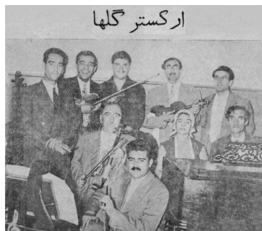
تصویر ۵. صبا و ارکستر او در استودیوی گل‌ها در رادیو ایران، ۱۳۳۶.

استودیوهای قدیمی که خوانندگان و نوازندگان آثار ماندگار خود را در آن‌ها ضبط کرده‌اند برای خود این هنرمندان و علاقه‌مندان به آن آثار همواره بسیار خاطره‌انگیز است. در ایران استودیوهای قدیمی بسیاری هست که بیشتر آن‌ها مربوط به رادیو و تلویزیون ملی ایران است. تعدادی استودیوی خصوصی در ایران هست که اغلب آن‌ها در شهر تهران قرار دارد. تصویر ۵، که در استودیوی گل‌ها در رادیو گرفته شده است، صحنه‌ای به‌یادماندنی از نواهای آن روزگار را توسط ابوالحسن صبا و سایر نوازندگان ارکستر او در سال ۱۳۳۶ به نمایش می‌گذارد.