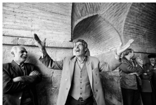
تصویر ۴. آواز خوانندگان حرفه‌ای و آماتور در زیر رواق‌های پل خواجه در اصفهان.

خوانندگان صاحب‌نام و خوانندگان جوان هر دو گروه از رواق‌های ایجادشده در زیر پل‌های خواجه و سی‌وسه‌پل برای خواندن آواز استفاده می‌کرده‌اند. امروزه گردشگران دقیقی را در این رواق‌ها می‌نشینند. این دقایق برای آنان یادآور آوازهایی است که در این مکان خوانده می‌شده است. برخی گردشگران با قرارگرفتن در این فضا خود نیز حال و هوای آواز خواندن پیدا می‌کنند و برای خود آوازهایی زمزمه می‌کنند (تصویر ۴).