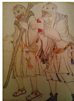
تصویر ۴- دو قلندر، ۹ ق، تبریز (?) خلیلی، لندن. ماخذ: (Rogers, 2010, 178)