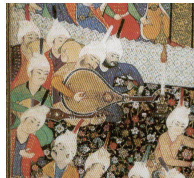
تصویر ۳- بخشی از سماع دراویش، بهزاد.