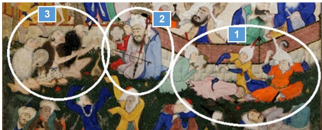
تصویر ۱- گروه‌های سه‌گانهٔ نوازندگان در مستی لاهوتی و مستی ناسوتی سلطان محمد، موزه فاک. ماخذ: (آژند، ۱۳۸۴، الف، ۱۵۸)