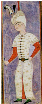
تصویر ۲- نقال صفوی. ماخذ: (آژند، ۱۳۸۹، ب. ۵۴۲)

بیتی که در بالاترین قسمت نگارهٔ مستی لاهوتی و ناسوتی دیده می‌شود (گرفته ساغر عشرت فرشتهٔ رحمت / ز جرعهٔ بر رخ حور و پری گلاب زده) ۶ ، نشان می‌دهد نگارگر، این اثر را متأثر از غزل ۴۲۱ دیوان کنونی حافظ پرداخته است. محمد استعلامی، زمان سرایش این غزل را دورهٔ شاه شجاع می‌داند که روزگار خوشی و رضایت حافظ است (استعلامی، ۱۳۸۳، ۱۰۷۲). این غزل، گردآمدن صاحب‌دلان در محضر پیرمغان را بازمی‌نماید و «یکی از زیباترین تابلوهایی است که ذهن حافظ آفریده» (همان) است. حافظ تنها در یک بیت این غزل (ز شور و عریدهٔ شاهدان شیرین‌کار / شکرشکسته، سمن‌ریخته، رباب‌زده) از سازی نام برده و بقیهٔ ایات، عاری از