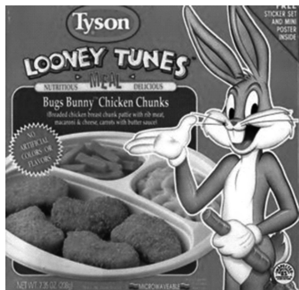
تصویر ۳- شخصیت باگزبانی در تبلیغ محصولات خوراکی.