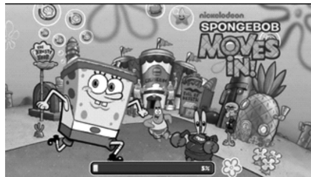
تصویر ۲- باب اسفنجی در نمایی از تبلیغ انیمیشنی محصولات نیکلودئون.

مزیت اول - تمایل به اخذ مجوز پخش شخصیت‌های مشهور کارتونی همچون باگزبانی ۴۶ یا بارت سیمپسون ۴۷ در عرصه تجاری