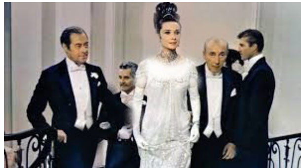
تصویر ۱۵- سکانس پایانی.

همانطور که سیاهی و سفیدی، چه از منظر روان‌شناسی و چه از نظر زیباشناسی و بصری، در دو نقطه مقابل یکدیگر قرار دارند، در فیلم آناکارنینا ، شخصیت‌های مثبت و منفی داستان در جایی که در مقابل یکدیگر قرار دارند، دارای پوشش و لباس سفید و مشکی می‌شوند. در فیلم بانوی زیبای من ، بازیگر اصلی در حال نبرد درونی و یا تحول شخصیتی است و روند از تیرگی به روشنایی، نشانگر رو به مثبت رفتن و پیشرفت شخصیتی و رفتاری وی است. در نتیجه در هر صحنه‌ای از فیلم که تضاد شخصیتی بازیگران و یا یک بازیگر با خودش به تصویر کشیده می‌شود، رنگ سیاه و سفید لباس، نقش مهمی را ایفا می‌کند. به نظر می‌رسد با توجه به نظریه‌ی بارت؛ هر کدام از عناصر سیاه و سفید به تنهایی معنایی