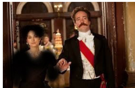
تصویر ۱- آن‌ها و برادرش.