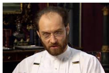
تصویر ۷- الکسی کارنین.