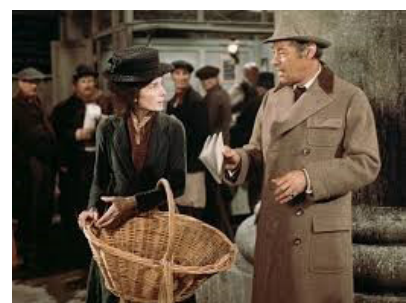
تصویر ۱۰- سکانس آغازین.