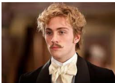
تصویر ۹- کنت ورونسکی