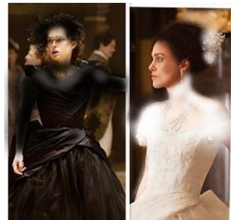
تصویر ۴- آن‌ها در ۲ صحنه متضاد.