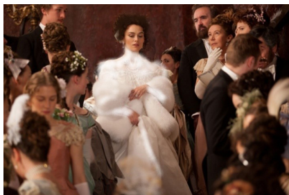
تصویر ۳- آن‌ها در مهمانی.

در ادامه فیلم، لباس آن‌ها از آنجایی که ناراضی از روابط زناشویی و همچنین دارای حس گناه نسبت به روابطش با کنت ورونسکی است، همچنان تیره است. ولی پس از آن، در صحنه‌هایی که آن‌ها عشقش به کنت ورونسکی را آشکار کرده است و به دلیل اینکه می‌خواهد در نظر