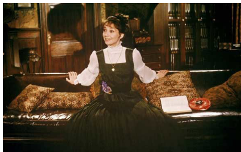
تصویر ۱۲- الیزا: تصویر از نگارنده برگرفته از فیلم

در ادامه‌ی فیلم، لباس الیزا از ترکیبات تیره و خاکستری خارج شده و رو به روشنی، خلوص رنگی و سفیدی می‌رود که نشانگر روند رو به رشد وی در آموزش زبان و تعلیمات پروفیسور است. در