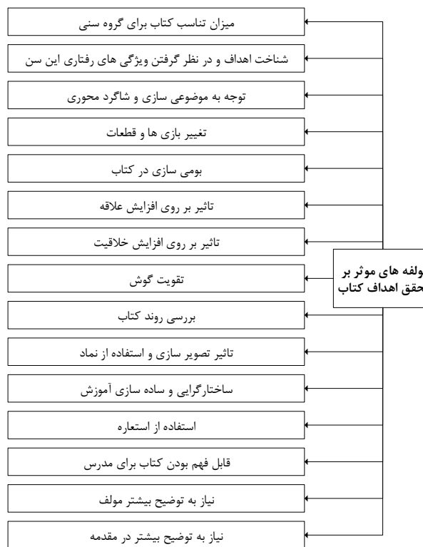
نمودار ۱- ریزکدهای استخراج شده از مصاحبه ها.

انجام می شود و به نظریه پرداز کمک می کند تا فرایند نظریه پردازی را به سهولت انجام دهد. کدگذاری انتخابی عبارت است از فرآیند انتخاب دسته بندی اصلی، مرتبط کردن نظام مند آن با دیگر دسته بندی ها، تأیید اعتبار این روابط، و تکمیل دسته بندی هایی که نیاز به اصلاح و توسعه بیشتری دارند (Strauss & Corbin, 1990). کدگذاری انتخابی، بر اساس نتایج کدگذاری باز و کدگذاری