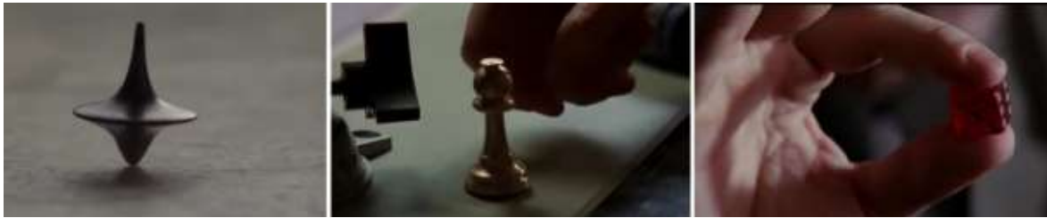
تصویر ۴- توجه به خُرده‌فرهنگ‌ها در فیلم تلقین در قالب توت‌م. به ترتیب از راست به چپ: تاس به عنوان توت‌م آرتور، مهره شطرنج به عنوان توت‌م آریادنی و نوعی فرفره به عنوان توت‌م دام‌کاب. مأخذ: (اصل فیلم)

۸- اختلال زبانی: مهم‌ترین اختلال‌های زبانی که در فیلم تلقین وجود دارد عبارتند از: تغییر غیرمنتظره زاویه دوربین (تصویر ۵) اعواج و دگردیسی فرم تصویر (تصویر ۶) و نادیده‌گرفتن نیروی جاذبه است (تصویر ۷). زاویه دوربین ۴۵، ۹۰ و ۱۸۰ درجه چرخش پیدا می‌کند، شخصیت‌ها در هوا شناور می‌شوند، ساختمان‌ها در نوسان هستند و تصویر دچار اعواج و محوی می‌شود. همه این تکنیک‌ها هم‌راستا با محتوای داستان است و درصدد ایجاد احساس تعلیق و پیچیدگی‌های ذهنی شخصیت داستان به بیننده است. به عبارت دیگر، فرم در هماهنگی کامل با محتوا قرار می‌گیرد. تکنیک‌های فنی فیلم‌برداری که غالباً برگرفته از تکنولوژی و فن‌آوری هستند، کاملاً به‌جا و مناسب در انتقال محتوا استفاده شده است.