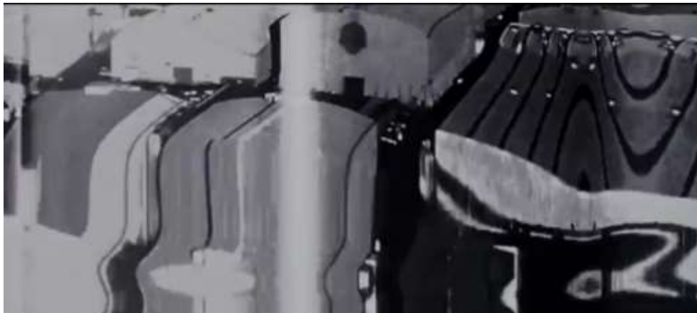
تصویر ۶- بهره‌گیری از اختلال زبانی در فیلم تلقین در قالب اعواج و دگردیسی تصویر.