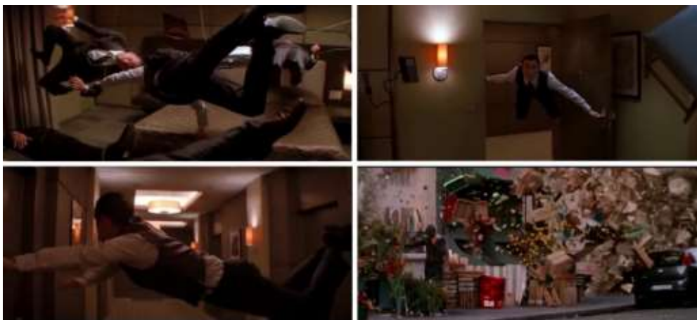
تصویر ۷- بهره‌گیری از اختلال زبانی در فیلم تلقین در قالب نادیده‌گرفتن نیروی جاذبه. مأخذ: (اصل فیلم)

می‌کند که در حال دیدن فیلم و در دنیای تخیل و رؤیا است و هیچ تلاشی در پنهان‌سازی رابطه ساختگی بین داستان و واقعیت نمی‌کند؛ و این بسته به درک و فهم بیننده است که تا چه اندازه متوجه این آشکارسازی شود. مثلاً در هر مرحله و لایه از خواب هرگاه دام‌کاب و گروهش قصد نفوذ به لایه‌ای عمیق‌تر را دارند، این دیالوگ تکرار می‌شود: «باید به خواب برویم». یا جمله: «خواب‌های خوش ببینید!».