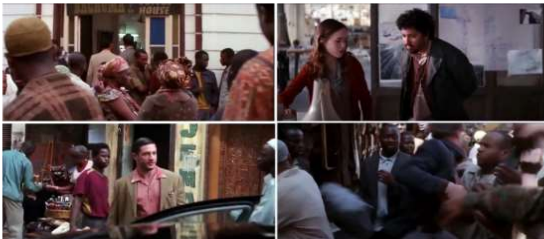
تصویر ۳- توجه به خُرده فرهنگ‌ها در فیلم تلقین در قالب نژاد کنیایی (یوسف) و عناصر معماری کنیایی (شهر مومباسا).

ما به واقعیتی می‌شود که سالیان درازی به سبب زندگی مدرن از فقدان آن غافل شده‌ایم و بازسازی آن بسی دشوار است. این خود وجهی از پُست‌مدرنیسم است که درصدد بازگشت به دنیای پیش از مدرن را دارد. ۲. توتم نقش حمایتی از انسان‌ها را دارد و فرشته حامی و نگهبان آنهاست. حمایت از موجودات انسانی در برابر خشم و اقتدار خدایان و شیاطین، حفظ کسانی که با مرده تماس داشته‌اند و پیشگیری از اختلالاتی که به هنگام تحقق پاره‌ای از اعمال بزرگ زندگی، ممکن است پیش بیاید (همان). گویا نقش توتم در فیلم تلقین با کارکردهایی که فروید برای آن در نظر گرفته است منطبق است. توتم برای دام‌کاب، آرتور و آریادنی در نقش شیء نمادین است که می‌بایست آن را همیشه به همراه داشته باشند، کسی غیر از همان فرد آن را لمس نکند وگرنه خاصیت جادویی خود را از دست می‌دهد و از همه مهم‌تر نقش حمایتی که برای آنها ایفا می‌کند. به‌قول آریادنی: «راه‌حل ظریفی برای تشخیص واقعیت از رؤیا». یا به قول دام‌کاب: «برای اینکه مطمئن شوی که داخل حافظه شخص دیگری نیستی» (تصویر ۴).