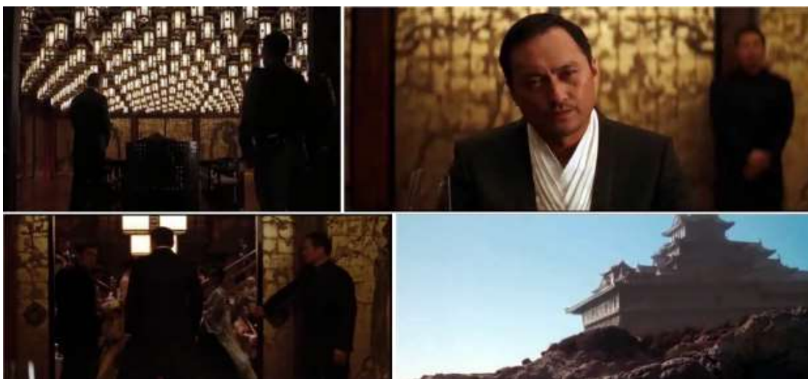
تصویر ۲- توجه به خُرده فرهنگ‌ها در فیلم تلقین در قالب نژاد ژاپنی (آقای ساتیو) و عناصر معماری ژاپنی.