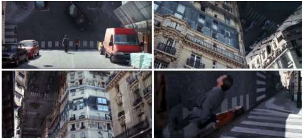
تصویر ۵- بهره‌گیری از اختلال زبانی در فیلم تلقین در قالب تغییر غیرمنتظره زاویه دوربین.

از دیگر نمونه‌های رد تقابلی‌های دوتایی در فیلم تلقین، علاوه بر لغو نژادپرستی، می‌توان لغو دیدگاه مردسالارانه دانست. این فیلم برخلاف دیدگاه‌های مردسالارانه گذشته که زنان را در حد یک عنصر منفعل در نظر می‌گرفت، خارج شده و زن به عنوان شخصیتی مهم و تأثیرگذار مطرح می‌شود. در فیلم تلقین، آریادنی زنی است که به دلیل عدم توانایی و لیاقت طراح قبلی (مردی به نام ایمز) و به سبب هوش بالایی که دارد، جایگزین ایمز شده و به عنوان برنامه‌ریز عملیات و طراح معمار هزارتوهای عجیب‌وغریبی که قرار است بعداً دام‌کاب و گروهش در آن حضور پیدا کنند، به گروه می‌پیوند. او همگام و برابر با دیگر شخصیت‌های مرد در داستان و صحنه ظاهر می‌شود و نقشی صرفاً منفعل ندارد. بنابراین فیلم تلقین عملاً بنیان‌های نظری برتری جنسی مردسالارانه را نقض می‌کند.