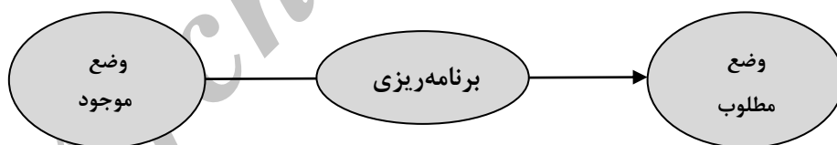
شکل شماره ۲- هدف و ماهیت برنامه‌ریزی

برنامه‌ریزی اقتصادی چیزی جز یک فرآیند اطلاع - تصمیم‌گیری نیست، فرآیندی که طی آن به صورت آگاهانه و ارادی، به منظور حصول به اهداف مشخص (مطلوب) اقتصادی مانند تولید ناخالص ملی، مصرف، سرمایه‌گذاری و... تصمیم‌گیری می‌شود (نظری، همان: ۲۰۷).