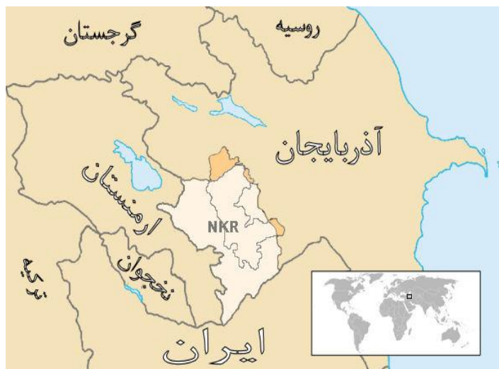
نقشه 1-3: موقعیت جغرافیایی جمهوری خودمختار نخجوان ( https://maps.google.com ).

کل جمعیت این جمهوری حدود 99/1 درصد ترک، 0/15 درصد روس تبار و بقیه را سایر قومیت‌ها مانند کردها و گرجی‌ها تشکیل داده‌اند (Nakhchivan, 2005:112).