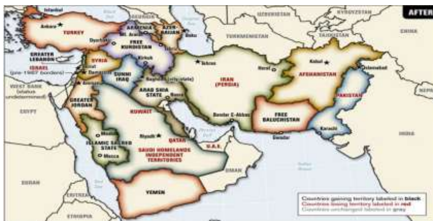
نقشه شماره ۱: مرزبندی های آینده خاورمیانه