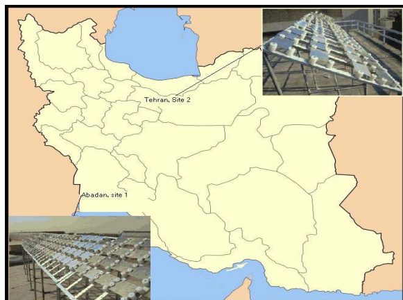
شکل (۱): موقعیت مکانی دو منطقه نمونه گذاری در ایران

جهت بررسی مقایسه ای اطلاعات دو منطقه، برای اندازه گیری کمیت های متفاوت از روش های یکسانی استفاده شد. شکل ۱ محل قرار گیری دو منطقه را روی نقشه ایران نشان می دهد، همچنین این مناطق برای راحتی مراحل بعدی شماره گذاری شده اند.