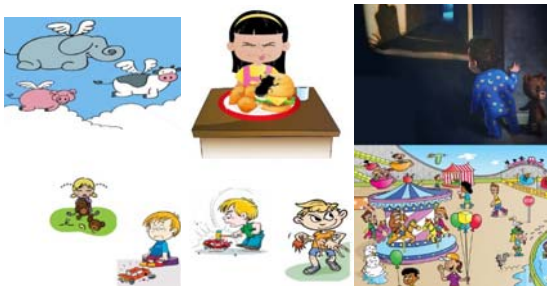
تصویر ۲. پازل موقعیت‌های تداعی‌کننده‌ی شش هیجان.