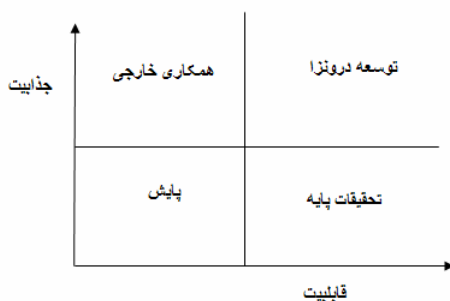
شکل ۱ ماتریس ارزیابی قابلیت - جذابیت [۱۱]

از تجمیع این سه دسته از اطلاعات، ماتریسی استخراج می‌شود که می‌توان از آن اطلاعات مورد نظر را روی یک نمودار دو بُرداری استخراج کرد و در آخر برای تکمیل راهبرد از آن بهره گرفت (شکل ۱).