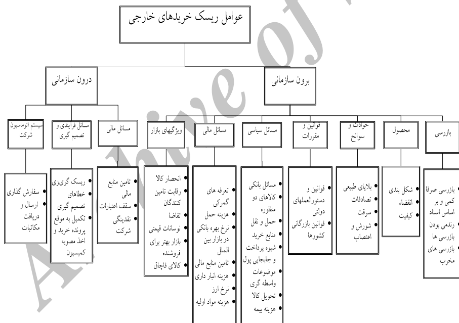
نمودار ۱ مدل مفهومی عوامل ریسک خریدهای خارجی

در تحلیل نتایج، برخی عوامل حذف شد و برخی تعاریف عوامل تغییر کرد. عواملی نیز علاوه بر عوامل مطرح شده اولیه به‌عنوان عوامل ریسک خریدهای خارجی از طرف نخبگان ارائه شد. عوامل ریسک خریدهای خارجی پس از تحلیل نتایج با استفاده از مرور ادبیات تحقیق و نظر خبرگان در قالب یک مدل مفهومی طبقه‌بندی شد. این مدل از طرفی عوامل ریسک را به دو دسته درون سازمانی و برون سازمانی تقسیم کرده و از طرف دیگر هر گروه عوامل را در قالب یک دسته کلی تقسیم‌بندی کرده است. این مدل در نمودار ۱ آمده است.