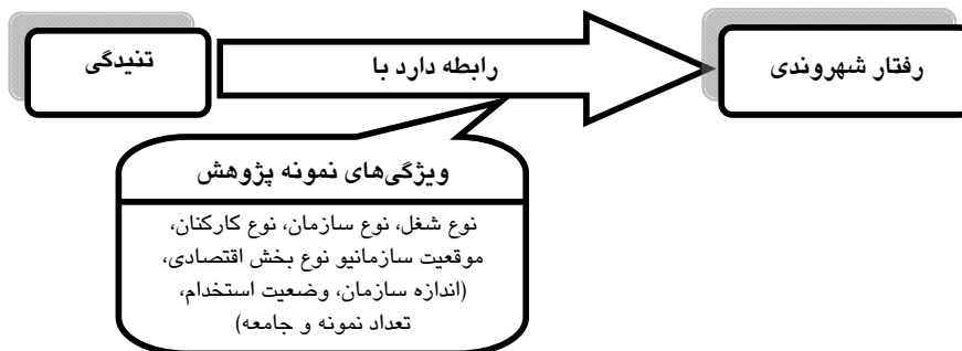
شکل ۲ مدل نهایی تحقیق

در این پژوهش، متغیرهای مربوط به ویژگی‌های نمونه که رابطه تنیدگی و رفتار شهروندی را متأثر ساخته‌اند، بررسی می‌شوند. این متغیرها شامل نوع شغل و بخش اقتصادی، اندازه و نوع سازمان و کارکنان، درجه توسعه یافتگی کشور، وضعیت استخدام، موقعیت سازمانی، تعداد نمونه و جامعه آماری می‌باشند. به تعداد این متغیرها فرضیه طراحی و آزمون انجام گرفت و در نهایت مشخص شد؛ نوع شغل، نوع سازمان، موقعیت سازمانی، نوع کارکنان و تعداد جامعه آماری رابطه تنیدگی و OCB را تعدیل نموده‌اند. البته از بین فرضیه‌های تأیید نشده نیز فرضیه‌های جزئی‌تر پذیرفته شدند که از جمله تفاوت اندازه اثر تنیدگی بر OCB-O، در دو بخش صنعت و خدمات، اثر اندازه سازمان بر رابطه تنیدگی عاطفی و OCB، اثر تعداد نمونه بر رابطه تنیدگی و OCB-O و اثر وضعیت استخدام بر رابطه تنیدگی و OCB-O می‌باشد. بنابراین با توجه به نتایج آزمون فرضیه‌ها مدل مفهومی پژوهش به شکل زیر نهایی می‌شود: