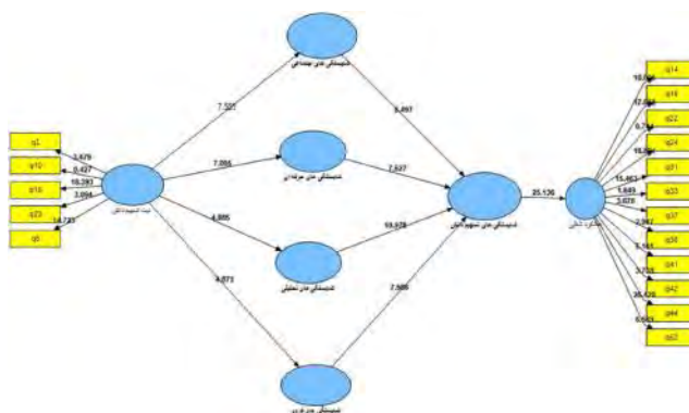
شکل ۳ ضرایب معناداری t مربوط به فرضیه‌ها (مقادیر بزرگتر از ۱/۹۶ معنادار در سطح ۰/۵۰)

براساس این تحلیل، نیت تسهیم دانش با ضریب مسیر ۰/۶۱۳ بر شایستگی‌های تسهیم دانش اثرگذار بود. شایستگی‌های تسهیم دانش نیز با ضریب مسیر ۰/۸۵۴ بر عملکرد شغلی تأثیرگذار بود و به این ترتیب دو فرضیه اول پژوهش تأیید شدند. به‌علاوه نیت تسهیم دانش به‌صورت غیر مستقیم و از طریق شایستگی‌های تسهیم دانش با ضریب مسیر ۰/۵۲۳ بر عملکرد شغلی تأثیر می‌گذاشت. در هر حال تأثیر مستقیم معناداری از طرف نیت تسهیم دانش در عملکرد شغلی یافت نشد و به این ترتیب دلیلی برای تأیید فرضیه سوم به‌دست نیامد.