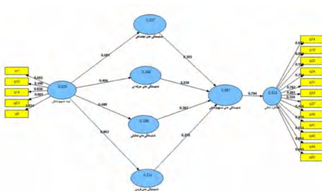
شکل ۲ ضرایب استاندارد شده مسیرهای مربوط به فرضیه‌ها برای بررسی مدل مفهومی

براساس این تحلیل، نیت تسهیم دانش با ضریب مسیر ۰/۶۱۳ بر شایستگی‌های تسهیم دانش اثرگذار بود. شایستگی‌های تسهیم دانش نیز با ضریب مسیر ۰/۸۵۴ بر عملکرد شغلی تأثیرگذار بود و به این ترتیب دو فرضیه اول پژوهش تأیید شدند. به‌علاوه نیت تسهیم دانش به‌صورت غیر مستقیم و از طریق شایستگی‌های تسهیم دانش با ضریب مسیر ۰/۵۲۳ بر عملکرد شغلی تأثیر می‌گذاشت. در هر حال تأثیر مستقیم معناداری از طرف نیت تسهیم دانش در عملکرد شغلی یافت نشد و به این ترتیب دلیلی برای تأیید فرضیه سوم به‌دست نیامد.