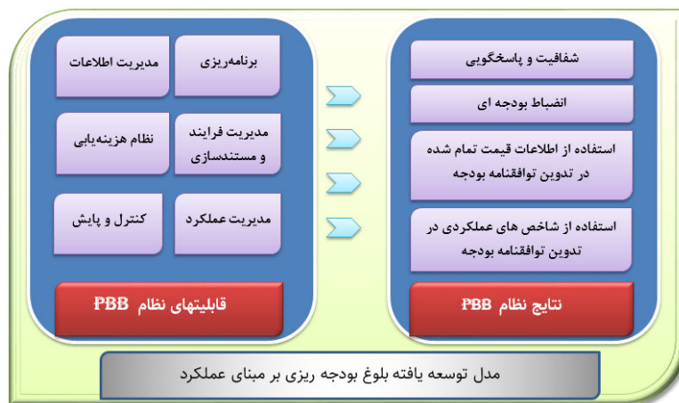
شکل ۲ مدل توسعه یافته بلوغ بودجه‌ریزی بر مبنای عملکرد

میزان استفاده از اطلاعات عملکردی دستگاه در تدوین بودجه نیز مانند سومین شاخص نتایج حایز اهمیت است. زیرسیستم مدیریت عملکرد در بخش قابلیت‌های مدل بلوغ تعریف شده است. با این حال صرف وجود یک زیرسیستم مدیریت عملکرد و عدم توجه در به کارگیری اطلاعات این زیرسیستم در تصمیم‌گیری و تدوین بودجه نمی‌تواند تصویر دقیقی از سطح بلوغ بودجه یک دستگاه در بحث مدیریت عملکرد ارائه نماید. بهره‌گیری از اطلاعات عملکردی در تدوین بودجه چهارمین شاخص نتایج در مدل بلوغ بودجه‌ریزی بر مبنای عملکرد است. به این ترتیب مدل توسعه یافته بلوغ بودجه‌ریزی بر مبنای عملکرد با در نظر گرفتن هر دو لایه از مدل بلوغ یعنی قابلیت‌ها و نتایج به شرح شکل ۲ است.