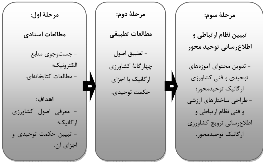
شکل ۱ مراحل اجرای پژوهش