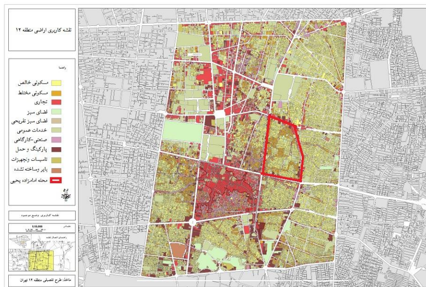
شکل 2 کاربری اراضی محدوده مطالعه