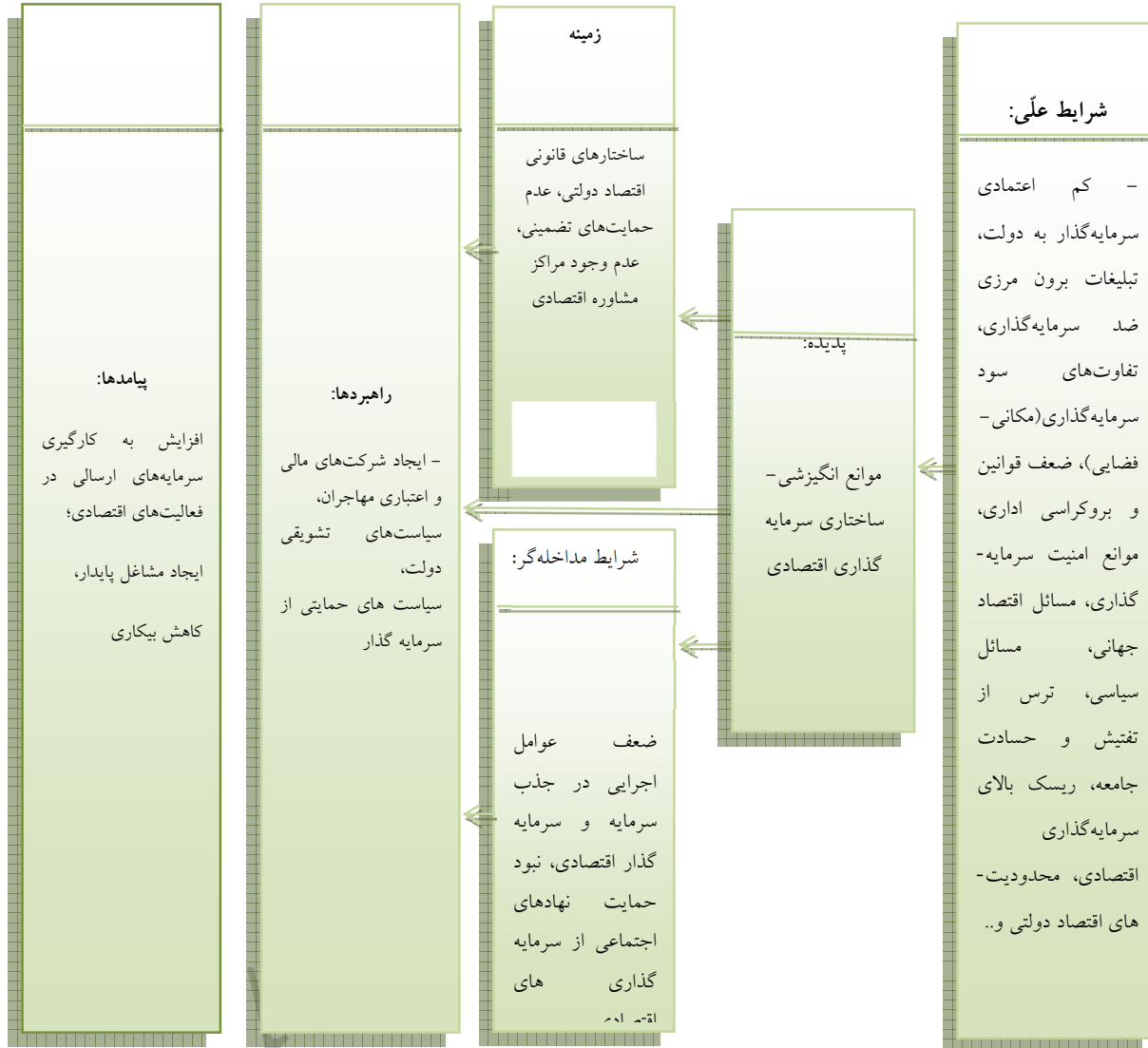
شکل ۲. مدل کانونی پژوهش