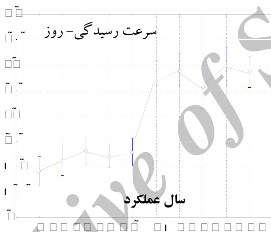
نمودار (۱) بررسی روند میانگین متغیرهای تحقیق

بررسی اطلاعات استخراج شده از پرونده های مالیاتی که در نمودار (۱) خلاصه شده است نشان می‌دهد که سرعت رسیدگی قبل از حسابرسی مالیاتی به مراتب کمتر از زمان حسابرسی مالیاتی بوده است.