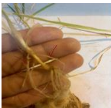
شکل ۴. ریشه اضافی در ژنوتیپ متحمل