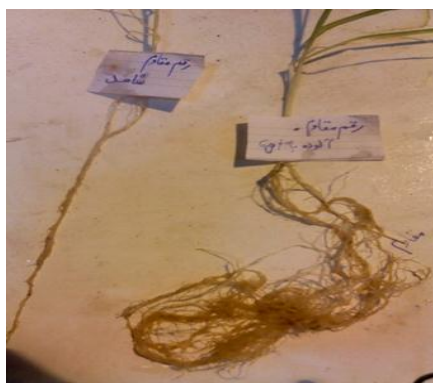
شکل ۹. مقایسه سیستم ریشه‌ای شاهد و آلوده سمت راست: تیمار آلوده، سمت چپ: تیمار شاهد

داده‌شده و تیپ رشد به‌شدت به هم وابسته‌اند ( \chi^2 = 67/792^{***} و \chi^2 = 64/441^{***} )، لذا مقاومت به این بیماری مستقل از نوع رشد نیست و ژنوتیپ‌های پاییزه مقاومت بیشتری به بیماری پآخوره گندم داشتند (جدول ۴).