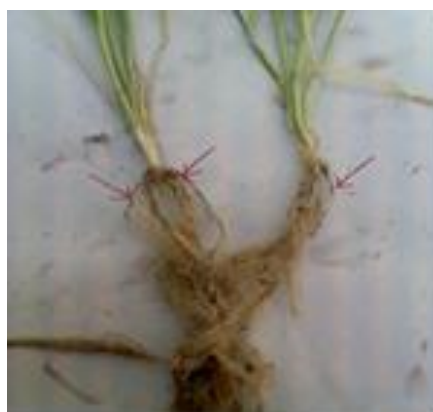
شکل ۷. وجود لکه‌های نکروزه روی ریشه و افزایش سیستم ریشه‌ای