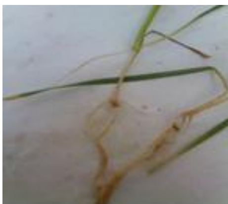
شکل ۸. گیاه کاملاً مقاوم

پایینی داشتند و سیستم ریشه‌ای آنها نیز به‌طور قابل توجهی کاهش یافته بود. در مقابل، تیمارهای آلوده (به جز در موارد آلودگی خیلی شدید) رشد رویشی بالایی داشتند و سیستم ریشه‌ای هم در آنها گسترش یافته بود؛ همچنین ریشه‌های اضافی نیز در آنها تشکیل شده بود (شکل‌های ۹ و ۱۰). به عبارتی، می‌توان استنباط کرد که به احتمال زیاد مقاومت درون گیاه القا می‌شود. مقاومت القایی یک روش محافظت بیولوژیک است که هدف آن فعال کردن سیستم