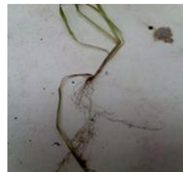
شکل ۶. گندم بهاره تحت تیمار آلودگی