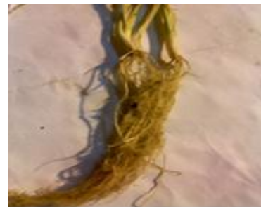
شکل ۵. گندم پاییزه تحت تیمار آلودگی

همچنین با مقایسه تیمارهای شاهد با آلوده در بیشتر موارد مشخص شد که تیمارهای شاهد که قارچ عامل بیماری روی آنها رشد نکرده بود، رشد رویشی