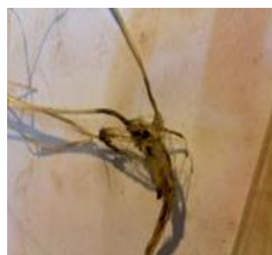
شکل ۳. گیاه نیمه‌حساس

جدول ۲. شماره ژنوتیپ‌های کشت شده در گلخانه و گروه‌بندی ژنوتیپ‌ها بر اساس میانگین نمره بیماری