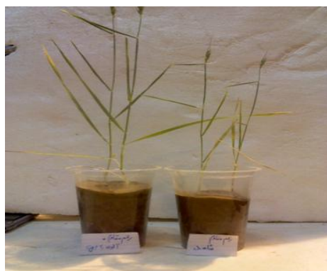
شکل ۱۰. مقایسه رشد رویشی شاهد و آلوده سمت راست: تیمار شاهد، سمت چپ: تیمار آلوده