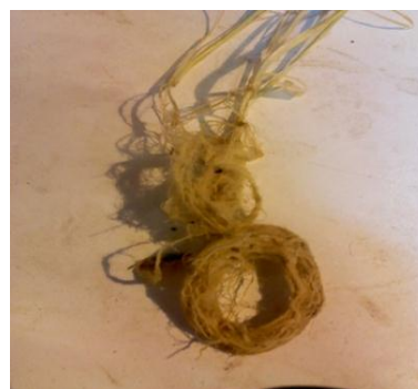
شکل ۱. گیاه مقاوم