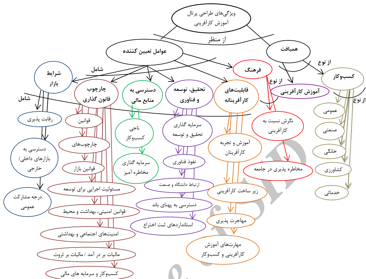
شکل ۲: هستان‌نگار ویژگی‌های همبافت و عوامل تعیین‌کننده پرتال آموزش کارآفرینی

جدید نیز از جمله مهارت‌های مورد نیاز کارآفرین پس از تاسیس شرکت هستند که به منظور ایجاد انگیزش در بین افراد و ایجاد کارآفرینان جدید، آگاهی دادن، هدایت و تشویق کارآفرینان به سوی کسب مهارت‌های لازم و ارائه آموزش‌های لازم برای کسب مهارت‌های مورد نیاز به کارآفرینان صورت می‌گیرد و گذراندن این دوره‌ها برای موفقیت کارآفرینانی که قبلاً هیچ گونه سابقه و زمینه محیطی لازم برای آنان فراهم نبوده، ضروری است.