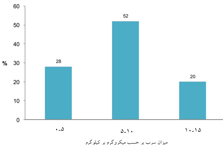
نمودار ۱- درصد توزیع سرب در نمونه های شیر خام مناطق مختلف استان یزد در سال ۱۳۸۷

شیرهای خام استان اصفهان را احتمالاً می توان به آلودگی بیشتر زیست محیطی به علت مصرف کودهای شیمیایی فسفات، وجود مراکز صنعتی متعدد، به ویژه صنایع بزرگ فولاد، سیمان و همچنین بالا بودن تعداد وسایل نقلیه نسبت داد. در بررسی دیگری که در سال ۱۳۸۶ در مورد