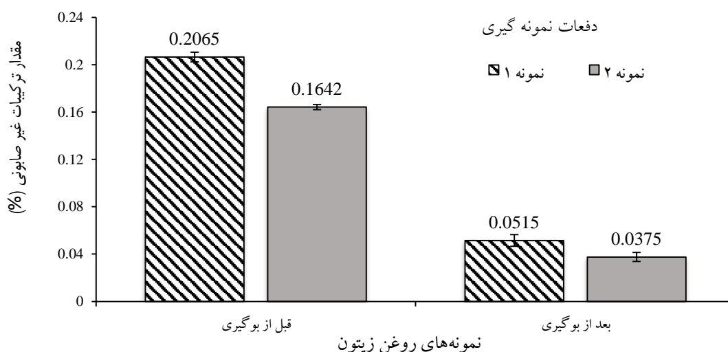
شکل ۱- ترکیبات غیر صابونی شونده موجود در روغن زیتون