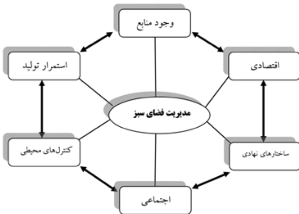
(نمودار شماره ۱) فرایند مدیریت توسعه پایدار در فضاهای سبز