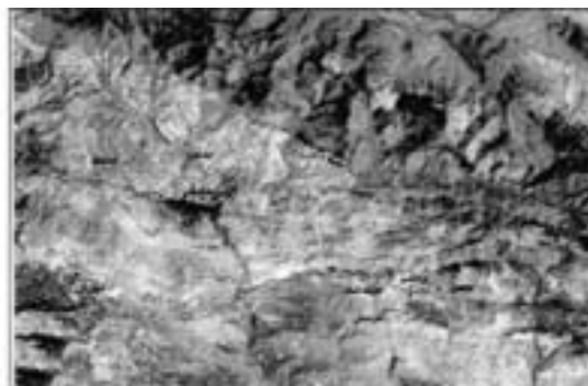
نقشه شماره ۱ موقعیت شهر جدید پردیس

۲۰۰۰هکتار میباشد. در نقشه شماره ۱ موقعیت، طرح تفصیلی و کاربری‌های شهر پردیس ارائه شده است. محیط فیزیکی شهر با توجه به قرار گرفتن در فاصله بین کوه و دشت از تنوع بالای میکروکلیمایی، توپوگرافی و سیستم هیدرولوژی برخوردار و در نتیجه باعث غنای محیط بیولوژیکی (فون و فلور) شده است.