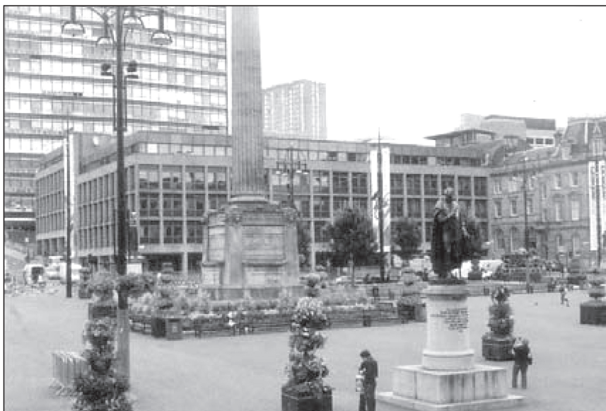
تصویر (شماره ۲۵): فضاهای باز شهری طراحی شده