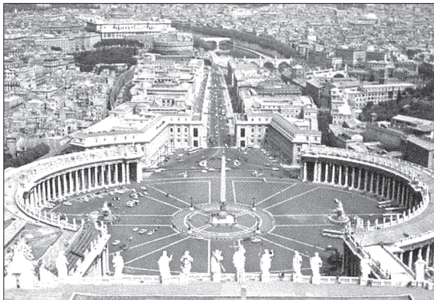
تصویر (شماره ۱۵): فضاهای باز شهری سنتی در بافت شهری