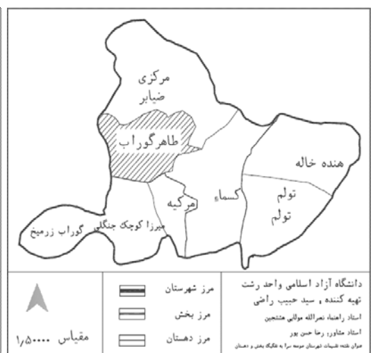
نقشه شماره ۱. شهرستان صومعه سرا به تفکیک بخش و دهستان و پراکنش آبادی‌ها در دهستان طاهرگوراب