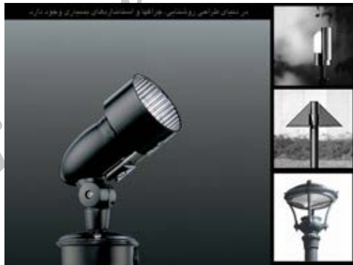
تصویر ۲. بهره گیری از تکنولوژیهای نوین نورپردازی در زیباسازی شهری؛ ماخذ: سازمان زیباسازی شهر تهران و جهاد دانشگاهی، ۱۳۹۱.

معروف بومی و اقلیمی و تاریخی معماری گردید که به مثابه انحراف از نخبه گرایی، و آوانگاردیسم بشمار می رفت. در نهایت پست مدرنیسم را می توان بر