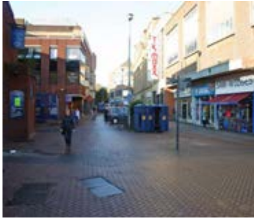
تصویر ۸. (قبل از اجرا) نمونه زیباسازی معابر در شهر دربی انگلستان، قبل از اجرا؛ ماخذ: سازمان زیباسازی شهر تهران و جهاد دانشگاهی، ۱۳۹۱.