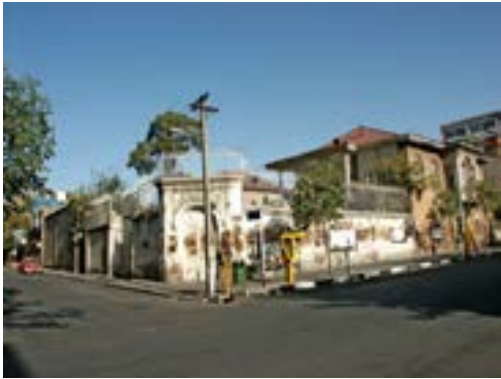
تصویر ۱۲. (قبل از طراحی) نمونه زیباسازی معابر در خیابان آصف تهران، قبل از طراحی؛ ماخذ: سازمان زیباسازی شهر تهران و جهاد دانشگاهی، ۱۳۹۱.