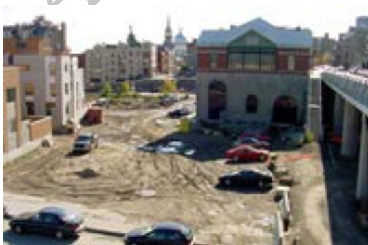
تصویر ۱۰. (قبل از اجرا) نمونه زیباسازی معابر در محله ساوت همپتون کانادا، قبل از اجرا؛ ماخذ: سازمان زیباسازی شهر تهران و جهاد دانشگاهی، ۱۳۹۱.

ج- طراحی محیطی و بهسازی فضای محلی مربوط به منطقه ای مسکونی، محله ساوت همپتون، کانادا: در این پروژه که در سطح طراحی فضای میان محله ای انجام شده است، بهسازی و طراحی پارک درون محله ای، کفسازی مطلوب و کاهش عناصر زائد محیطی مورد توجه قرار گرفته است.