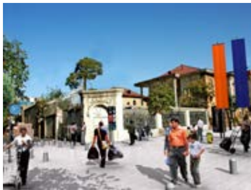
تصویر ۱۳. (بعد از طراحی) نمونه زیباسازی معابر در خیابان آصف تهران، بعد از طراحی؛ ماخذ: سازمان زیباسازی شهر تهران و جهاد دانشگاهی، ۱۳۹۱.

شهری که خصوصاً در جهان امروز به سبب تغییر شیوه های زندگی و ظهور نیازهای جدید بیش از گذشته پرداختن به این مساله لازم به نظر می رسد. چنانچه شهر را در رویکردی انسان شناختی معلول زیست انسانها در محدوده جغرافیایی مشخصی بدانیم آنچه سبب هویت یافتن این محدوده می گردد انسان و مسائل مربوط به آن چون فرهنگ و ویژگی های فرهنگی و اعتقادی آن است، بنابراین زیبایی و تعاریفی که از زیبایی در فضاهای شهری ارائه می شود تحت تاثیر فرهنگ ها و مدل های فرهنگی حاکم در هر شهر قرار می گیرد که بر این اساس مفهوم زیبایی و تعبیر و تعاریفی که از آن می شود تغییر پذیر و نسبی خواهند بود اما در این میان عواملی وجود دارند که به