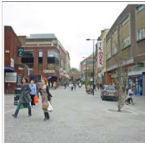
تصویر ۹. (بعد از اجرا) نمونه زیباسازی معابر در شهر دربی انگلستان، بعد از اجرا؛ ماخذ: سازمان زیباسازی شهر تهران و جهاد دانشگاهی، ۱۳۹۱.