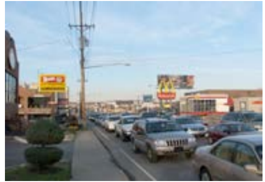
تصویر ۶. (قبل از اجرا) نمونه زیباسازی معبر در شهر گرین هیل آمریکا، قبل از اجرا؛ ماخذ: سازمان زیباسازی شهر تهران و جهاد دانشگاهی، ۱۳۹۱.