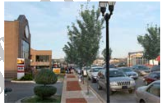
تصویر ۷. (بعد از اجرا) نمونه زیباسازی معبر در شهر گرین هیل آمریکا، قبل از اجرا؛ ماخذ: سازمان زیباسازی شهر تهران و جهاد دانشگاهی، ۱۳۹۱.

بهبود کفسازی، خالی کردن پیاده رو از ماشین، کاشت گونه های گیاهی و بهسازی زیرساختها و کفسازی های فضاهای شهری مورد توجه قرار گرفته است.