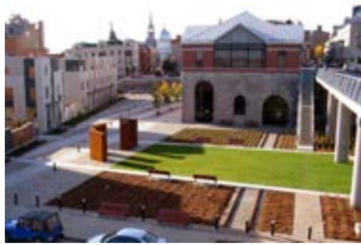
تصویر ۱۱. (بعد از اجرا) نمونه زیباسازی معابر در محله ساوت همپتون کانادا، بعد از اجرا؛ ماخذ: سازمان زیباسازی شهر تهران و جهاد دانشگاهی، ۱۳۹۱.

شهری که خصوصاً در جهان امروز به سبب تغییر شیوه های زندگی و ظهور نیازهای جدید بیش از گذشته پرداختن به این مساله لازم به نظر می رسد. چنانچه شهر را در رویکردی انسان شناختی معلول زیست انسانها در محدوده جغرافیایی مشخصی بدانیم آنچه سبب هویت یافتن این محدوده می گردد انسان و مسائل مربوط به آن چون فرهنگ و ویژگی های فرهنگی و اعتقادی آن است، بنابراین زیبایی و تعاریفی که از زیبایی در فضاهای شهری ارائه می شود تحت تاثیر فرهنگ ها و مدل های فرهنگی حاکم در هر شهر قرار می گیرد که بر این اساس مفهوم زیبایی و تعبیر و تعاریفی که از آن می شود تغییر پذیر و نسبی خواهند بود اما در این میان عواملی وجود دارند که به