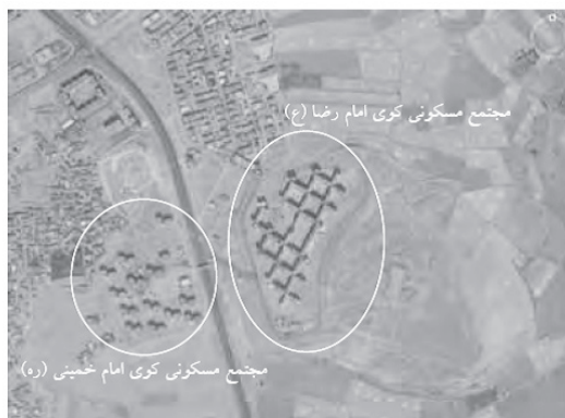
نقشه هوایی ۱. موقعیت مکانی مجتمع‌های مسکونی مورد مطالعه؛ ماخذ: گوگل ارث.