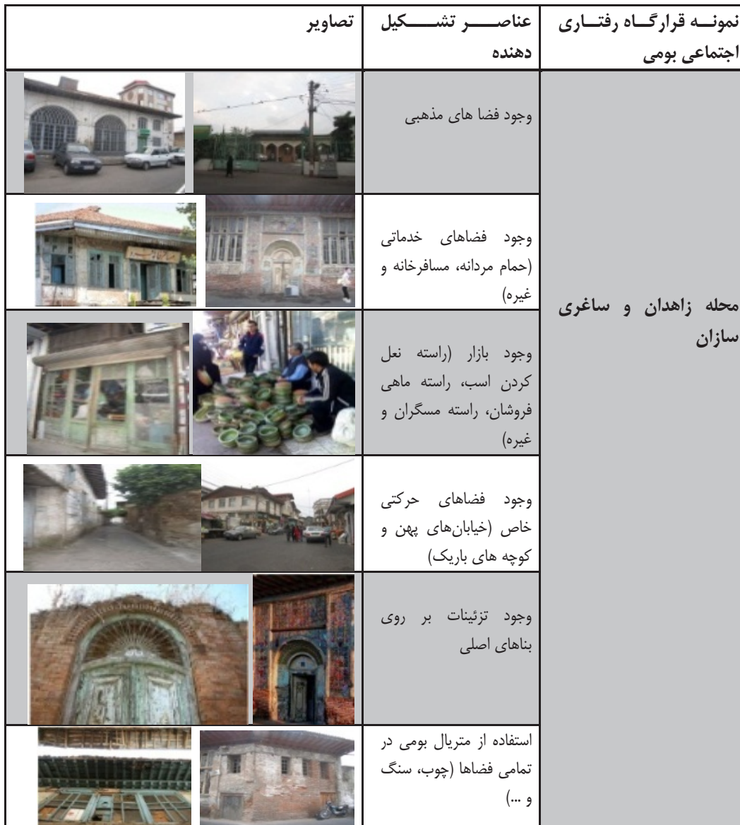
جدول ۴. عناصر معماری بومی قرارگاه های رفتاری اجتماعی بومی گیلان