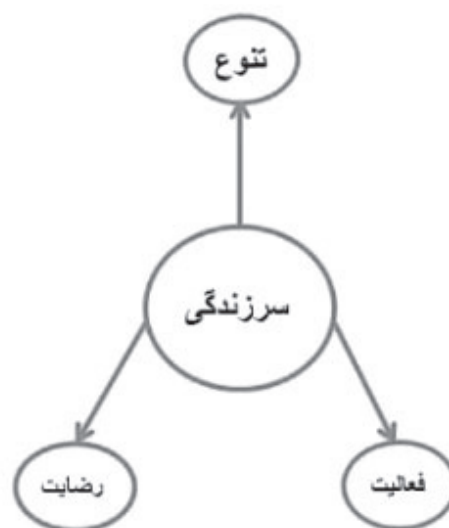
نمودار ۱. فاکتورهای سرزندگی در قرارگاه های رفتاری اجتماعی؛ ماخذ: نگارندگان.

با توجه به جدول همبستگی می بینیم که بیشترین همبستگی مربوط میزان تاثیرگذاری عوامل وجود فضاهای مذهبی (مسجد و غیره) در قرارگاه رفتاری اجتماعی و وجود تزئینات بر روی بناهای اصلی که موجب افزایش فعالیت شهروندان خواهد شد و با