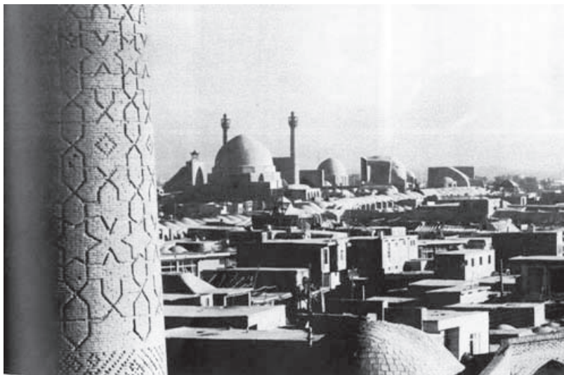
تصویر ۱. مفهوم سنت در معماری به تعبیر شولتز چگالی فهم هرمنوتیکی سنت معماری، لحظه رویارویی و ورود به مکان را به لحظه ای مهم بدل میسازد که خود، محصول ارتباط موضوعی متن (معماری) و زمینه (محیط) است.