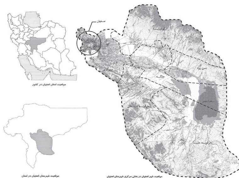
نقشه ۱. موقعیت شهر اصفهان