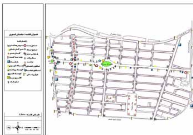
نقشه ۲. عناصر مبلمان در محدوده مورد مطالعه