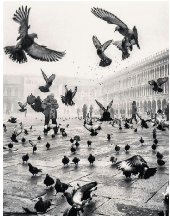
تصویر ۲. نمودی از رویدادهای روزمره؛ مأخذ: www.mulpix.com