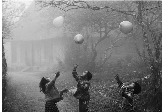
تصویر ۱. بازی کودکان، نمودی از رویدادهای روزمره؛ مأخذ: National