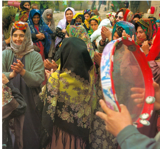
تصویر ۴: رقص‌های محلی، رویداد بومی؛ مأخذ: شهبازی، ۱۳۹۰، ص ۲۱۶.

رشد شهر نه زاده ذهن یک نفر است و نه زاده یک گروه منسجم از اذهان. شهر زاده میلیون‌ها میلیون فعالیت منفرد ساختمانی است (الکساندر، ۱۳۹۰، ص ۴۳۲). از آنجا که رویدادهای زندگی بخش و وابسته به روند طبیعی زندگی روزمره افراد است، بنابراین یک نفر مولف آن نبوده و این رویدادها قابلیت رشد و توسعه در زمان‌ها و مکان‌های مختلف و توسط افراد مختلف را می‌بایست دارا باشند. به علاوه رویداد به واسطه ذات خود قابلیت قرارگیری و تکرار در ظرف‌ها با مقیاس‌های مختلفی را دارند. در واقع، زندگی، روح و سیستمی زنده و مجموعه‌ای از الگوی رویدادهای همجوار و در تعامل با یکدیگر است که در هر یک رویدادهای مشخصی بارها و بارها تکرار می‌شود.