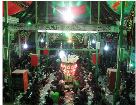
تصویر ۵. تکیه تجریش در دهه محرم، نمودی از مکان شکل گرفته به واسطه یک رویداد؛ مأخذ: نگارندگان.

عنصر حرکت برای شکل دهی به فضا عامل حرکت خود می‌تواند شکل دهنده به فضا باشد. در حرکات سازمان یافته، یعنی حرکات آیینی شده و رمزی شده، بدن‌ها خودشان فضاها را ایجاد می‌کنند. (تصویر ۷) همچنین، قلمرو حرکتی خرد روزمره فضاها را خودش را ایجاد می‌کند (برای مثال، پیاده‌روها، راهروها، مکان‌های غذاخوری)، و همین‌طور قلمرو حرکتی کلان بسیار رسمی فضاها را خودش را به وجود می‌آورد (برای مثال دالان‌های کلیساهای