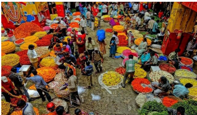
تصویر ۸. بازار روز سبزی و میوه، فضایی با ادراک چند وجهی؛ مأخذ: www.mole24.it